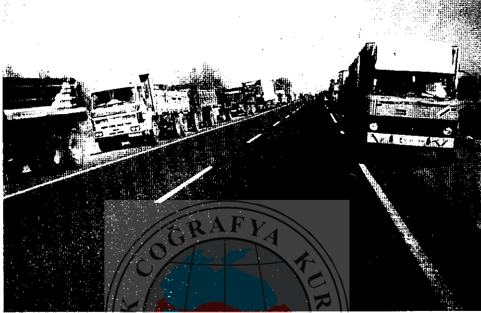
Fotoğraf 3. Dilucu kapısından Nahçıvan'a geçiş yapmak için sıra bekleyen kamyonlar Photo 3. Lorries waiting for passing from Dilucu border gate to Nahçıvan