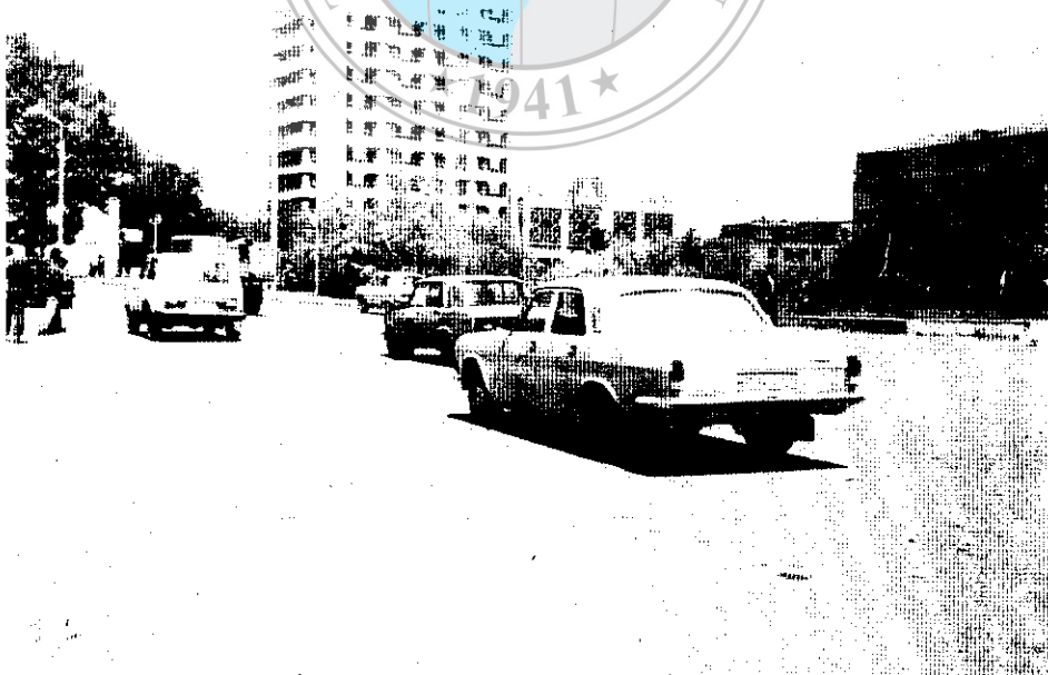
Fotoğraf 2. Nahçıvan kentinden bir görünüş Photo 2. An appearance of Nahçıvan city

Azerbaycan'a bağlı bir özerk cumhuriyet olan Nahçıvan'ın yüzölçümü 5500 km 2 , nüfusu ise 295 bindir (1991). Ülkede Nahçıvan kenti (70 000 nüfus), Babek, Culfa, Ordubat, Sederek ve Şerur ilçeleri ile 214 köy vardır. Nüfusunun