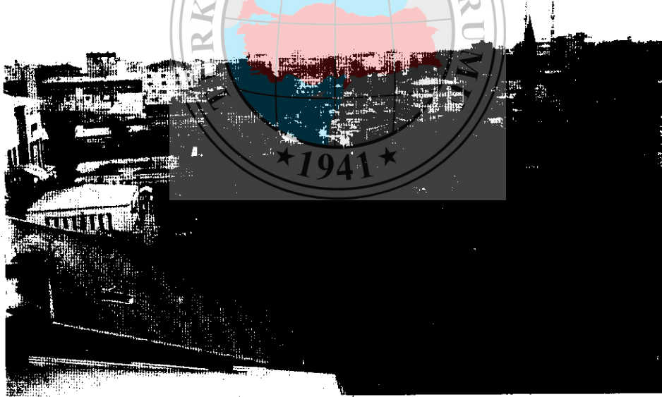
Fotoğraf 4. İğdir kentinin genel görünüşü Photo 4. General view of Iğdir city

Yörenin başlıca ticaret ve alış-veriş merkezini oluşturan İğdir kentinin ekonomik hayatındaki gelişmeler, kentin çevresindeki yerleşmeler için bir göç çekim merkezi olmasını sağlamış ve buna bağlı olarak da il merkezinin nüfusu çok dikkat çekici bir şekilde artmıştır. Nitekim 1997 nüfus sayımı sonuçlarına göre, Doğu Anadolu Bölgesi'nde bulunan illerin çoğunda nüfus azalması olduğu hal-