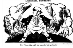
Görsel 1. Birinci Karikatür