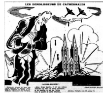
Görsel 10. Onuncu Karikatür

Onuncu karikatür, 16 Temmuz 1943 tarihinde yayımlanmıştır. Karikatür, Les Demolisseurs de Cathedrales (Katedral Yıkıcılar) başlığını taşımaktadır. Karikatürün altında Roosevelt adresse au pape une lettre hypocrite par laquelle il s'engage à respecter les églises et cathedrales italiennes. Les Journaux (Roosevelt, Papa'ya İtalyan kiliselerine ve katedrallerine saygı göstereceğine söz verdiği ikiyezli bir mektup gönderir. Les Journaux), Selon divers besoins, il est une science. D'étendre les liens de notre conscience. Et de rectifier le mal de l'action. Avec la pureté de notre intention (Çeşitli ihtiyaçlara göre bir bilim vardır. Bilincimizin bağlantılarını genişletmek için. Ve eylemin kötülüğünü düzeltmek için. Niyetimizin saflığıyla) ve Molière, Tartuffe, acte IV, scène V. (Molière, Tartuffe, IV. Perde, V. sahne) yazıları bulunmaktadır.