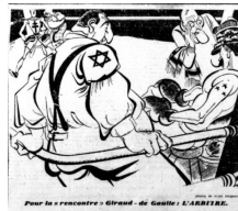
Görsel 8. Sekizinci Karikatür

Sekizinci karikatür, 22 Ocak 1943 tarihinde yayımlanmıştır. Karikatürün altında Pour la "rencontre" Giraud - de Gaulle: L'arbitre ("Karşılaşma" için Giraud - de Gaulle: Hakem) yazısı bulunmaktadır.