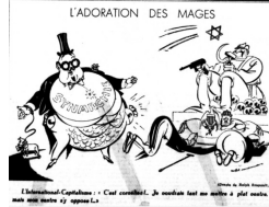
Görsel 12. On İkinci Karikatür

On ikinci karikatür, 7 Ocak 1944 tarihinde hazırlanmıştır. Karikatür, L'adoration de Mages (Hokkabazların Hayranlığı) başlığını taşımaktadır. Karikatürün altında L'Internationale-Capitalisme: C'est cornélien!... Je voudrais tant me mettre a plat ventre, mais mon ventre s'y oppose!... (Enternasyonal-Kapitalizm: Kızılılık!... Karnım üzerine dümdüz yatmayı çok isterdim ama midem buna karşı!...) yazısı bulunmaktadır.