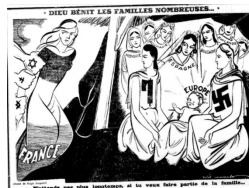
Görsel 3. Üçüncü Karikatür

Üçüncü karikatür, 20 Aralık 1941 tarihinde yayımlanmıştır. Karikatür "Dieu bénit les familles nombreuses..." ("Tanrı geniş aileleri korusun...") başlığını taşımaktadır. Karikatürün altında - N'attends pas plus longtemps, si tu veux faire partie de la famille... (- Ailenin bir parçası olmak istiyorsanız daha fazla beklemeyin...) yazısı bulunmaktadır.