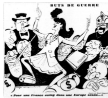
Görsel 4. Dördüncü Karikatür

Dördüncü karikatür, 6 Haziran 1942 tarihinde yayımlanmıştır. Karikatür, Buts de Guerre (Savaşın Hedefleri) başlığını taşımaktadır. Karikatürün altında " Pour une France swing dans une Europe zazou... " ("Avrupa Zazou"unda Fransa cazı") yazısı bulunmaktadır.