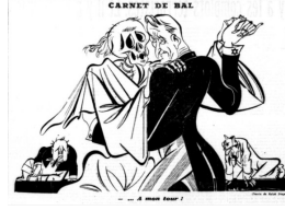
Görsel 2. İkinci Karikatür