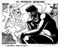
Grsel 5. Beřinci Karikatr

Beřinci karikatr, 17 Temmuz 1942 tarihinde yayımlanmıřtır. Karikatr, Le Penseur Bicolore (ift Ynl Dřnen) bařlıęını tařımaktadır. Karikatrn altında J'y pense... Donc je suis!... (Dřnyorum... yleyse varım!...) yazısı bulunmaktadır.