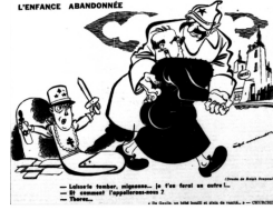
Görsel 11. On Birinci Karikatür

On birinci karikatür, 30 Temmuz 1943 tarihinde yayımlanmıştır. Karikatür, L'enfance Abandonnée (terk edilmiş çocuk) başlığını taşımaktadır. Karikatürün altında sırasıyla Laisse le tomber, mignonne... je t'en ferai un autre!... (Bırak tatlım... Sana bir tane daha yapacağım!...), Et comment l'appellerons-nous? (Ve buna ne diyeceğiz?) ve Thorez 10* yazısı bulunmaktadır. Karikatürün sağ altında ise "De Gaulle, un bebe bouffi et plein de vanite..." Churchill ("De Gaulle, kibir dolu böbürlenmiş bir bebek..." Churchill) yazısı yer almaktadır.