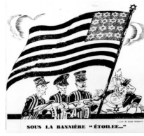
Görsel 7. Yedinci Karikatür