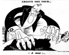
Görsel 6. Altıncı Karikatür

Altıncı karikatür, 13 Kasım 1942 tarihinde yayımlanmıştır. Karikatür, Chacun Son Tour... (Her biri sırayla...) başlığını taşımaktadır. Karikatürün altında – A moi!... (bana!...) yazısı bulunmaktadır.