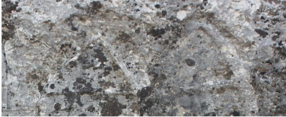
Görsel 6. Hilar Mağaraları, Üçgen Sembolü

Tarih öncesine gidildiğinde de; Uygurlar, Hoço’ da kubbeli yapıda mezar anıtları yapmışlardır. Yapının köşesinde ilk defa bir üçgen yer almıştır. Türk üçgenleri sonra Selçuklu ve Osmanlı mimarisinde önemli rol oynamıştır. “Anadolu coğrafyasında da muskalar üçgen şeklindedir. Eşkenar üçgen bütün üçlü masonik değerlerin simgesidir. Bu üçgenin kenarları özgürlük, eşitlik ve kardeşliği simgeler. Açıkları ise, aklını, gücünü (eylemi) ve güzelliğini gösterir” (Ersoy, 2007). Kenarların üstte birleşmesi yab-yam (baba-anne) duruşunun sanattaki temsilinde olduğu üzere dişi ve erkek üreme güçlerinin birleşmesi anlamına gelir.