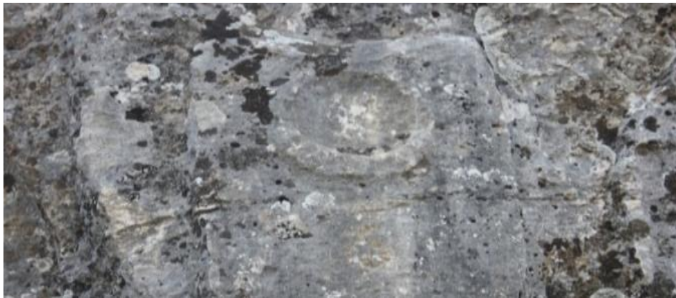
Görse 5.Hilar Mağaraları, Daire Sembolü

MÖ 2800’lerde Mısır’ da yaşayanlar, dairenin ya da halka şeklindeki çizimlerin başlangıç ve bitiş noktalarının olmaması nedeniyle sonsuzluğu temsil ettiklerine inanıyorlardı. Bu bakımdan yüzüğün de evliliğin sonsuza dek süreceğini simgelediğine inanılmaktaydı. Bugün bile Orta Asya ile bağlantısı olduğu düşünülen ve çalışmalarına devam edilen Kızılderili kabilelerinde ise daire, büyük ruhun kozmik görüntüsüdür. Çünkü yerdeki bir gözlemciye göre ay, güneş ve yıldızların yörüngeleriyle doğada büyüyen her şey daima bir daire çizmektedir (Ersoy, 2007, s. 160, 165)