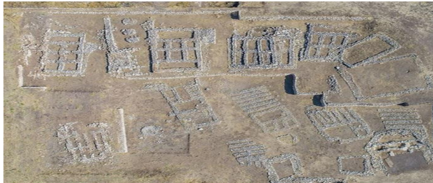
Görsel 1. Ergani Hilar Çayönü Yerleşkesi

M.Ö. 7300–6750 yılları arasında, yani günümüzden 9000 yıl öncesine kadar uzanan Çayönü yerleşmesi, insanların ilk besin üretimi aşamasını gerçekleştirdikleri döneme ilişkin çok gelişkin bir toplumsal yapıyı yansıtır. Yapı kalıntıları bu dönem için doğal görünen basit barınaklar olmaktan çok daha ötede, iyi tasarlanmış, kullanım ve yaşam alanları iyiden iyiye belirlenmiş ve kalıplaşmış bir geleneğin temsilcileridir. Avcı ve toplayıcı bir topluluk, köy dediğimiz ilk yerleşim yerini kurmuşlardır (Özdoğan, 2011).