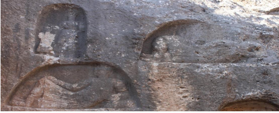
Görsel 4. Hilar Mağaraları, Figüratif Kabartmalar

Toplu kaya mezarlarının bulunduğu alanda, üç mezar odasının bulunduğu bölümün hemen üzerinde üç adet yarım daire benzeri yapı içerisinde toplam dört figür bulunmaktadır. Bölümlerden birisinde kadın görünümüne sahip bir figür ve hemen yanında bir çocuk figürü bulunmaktadır. Bu figürler ayakta tasvir edilmişlerdir. Diğer iki bölüm içerisindeki figürler ise uzanmış ve bir kolları arkaya yaslanmış şekilde betimlenmiştir. Tüm kabartmalarda dönemin erkek, çocuk ve kadınlarının giyim ve kuşamlarına ait ipuçlarını görmek mümkündür. İki erkek figürünün duruşlarına bakıldığında uzanmış iki erkek figürün rahat bir şekilde uzanmış oldukları görülmektedir. Bu rahat duruşları sebebiyle soylu veya toplumsal hiyerarşi içinde üst tabakaları temsil etme ihtimalleri bulunmaktadır. Ayrıca bu tasvirlerde rahatlığı sembolize eden bu duruşla ölümden sonraki yaşamları betimlenmiş olabilir.