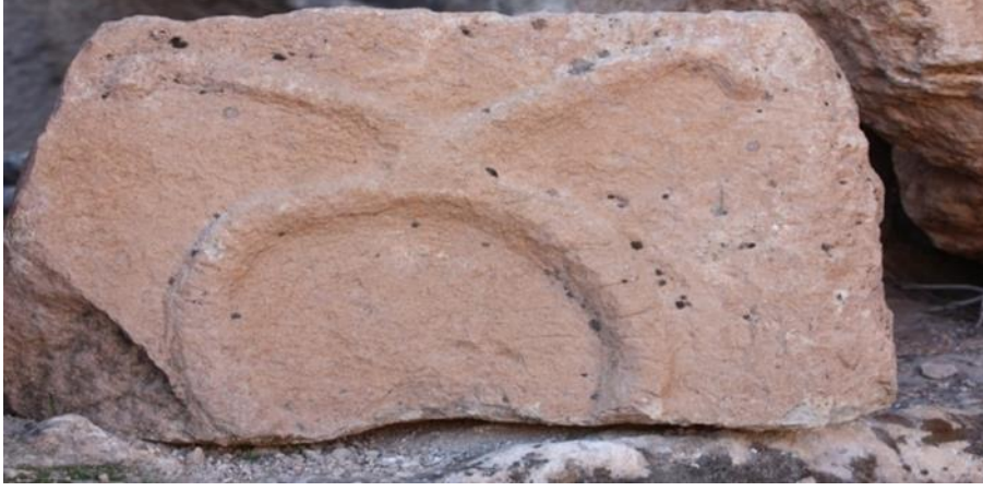
Görsel 8.Hilar Mağaraları, Damga (Tamga)

“Yazının embriyoları” olarak nitelendirilen resimler, insan düşüncesinin ilk grafik kayıtlarıdır. Yukarı paleolitik çağda mağara duvarlarına kazılmış insan ve hayvan figürleri, geometrik şekiller, çeşitli nesnelere, insanlığın gözle algılanabilir malumat bırakma ve böylece bir bellek oluşturma ihtiyacına hizmet etmiştir. (User 2006: 15) Damgalar, bir dilin alfabeleri ve aynı zamanda ait oldukları sosyal grupların kendileri için tarihe miras bıraktığı ilk anlatı metinleri biçiminde tanımlanabilirler. Bu sebeple damgalar, sosyo-kültürel araştırmalarda başvurulması gereken öncelikli vesikalardır. Bunlar, bir sosyal grubun veya bir milletin sosyal tarihini açıklayabilme gücüne sahip bilgiler ve deneyimlerin yanı sıra, duygu ve düşüncelerin ifadesini, bireylerin ve sosyal grupların estetik/beğeni algılamasını bünyelerinde taşırlar. Dolayısıyla, damgalar, birer sanat eseri olmaktan öte, her biri bir duygunun, bir sosyo-kültürel hayatın/hayatların, başka bir ifadeyle, sosyal yapıların dile getirildiği yazılı anlatı metinleri, yazılı tarih vesikaları kıymetindedir (Aksoy, 2011:133).