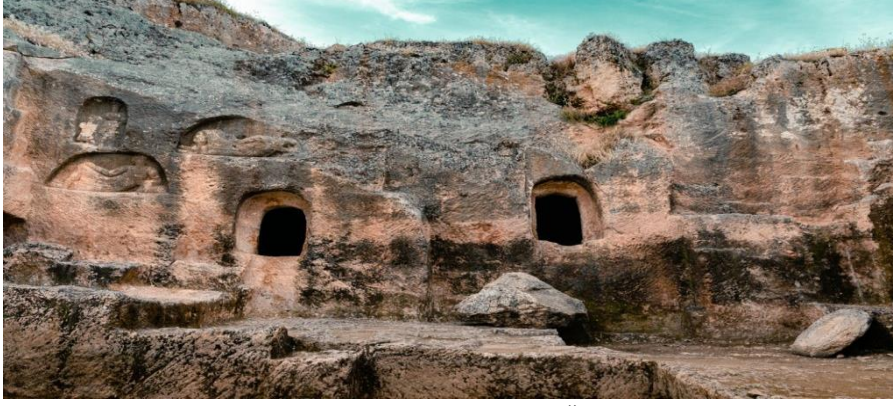
Görsel 2. Çayönü, Hilar Mağaraları

Tarihi Çayönü kalıntıları, Ergani ilçesinin Hılar mahallesi yakınlarında Hilar Mağaraları'nın bulunduğu yerdedir. 1964'ten beri sürdürülen kazı çalışmaları ışığında bölgenin, geçmişi M.Ö. 9. bin yıla kadar giden, Anadolu ve Mezopotamya'nın en eski yerleşim yerlerinden biri olduğu anlaşılmıştır. Buradaki buluntuların M.Ö. 7500 ile 6250 yılları arasına ait olduğu ve yörenin ilk insanlarca kullanıldığını ortaya koymakla beraber Çayönü M.Ö. 2000 yılına kadar Taş devri ve Tunç devrini içeren üç kültür evresi yaşamıştır. Çayönü, yakın doğunun en geniş açılmış ve korunmuş Neolitik yerleşmesi olarak ün yapmıştır. Çayönü'nün en bilinen yapısı Skull building (kafatası binasıdır.) (Url1).