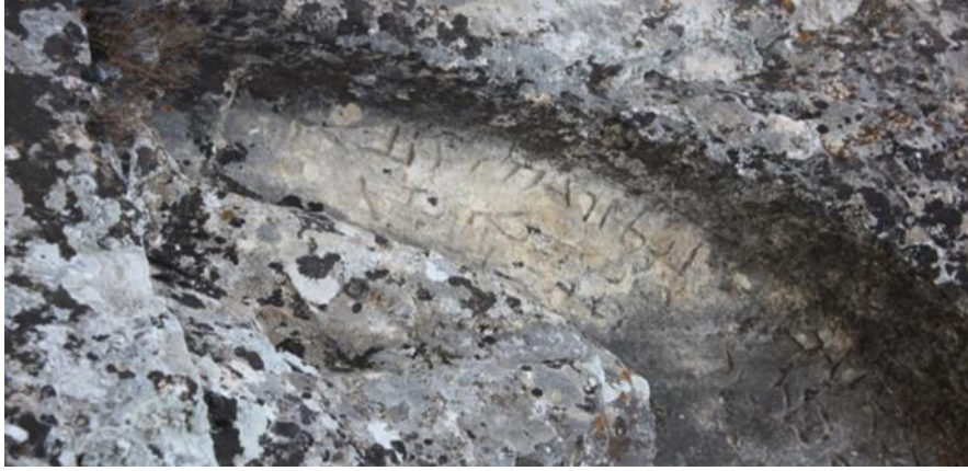
Görsel 9. Mağara girişlerinin yakın yerlerde bulunan yazıtlardan örnekler

Toplu şekilde bulunan mağaralarda sadece bir mağaranın üst kısmında görebiliyoruz yazıtı, ayrıca farklı tepelerde bulunan mağara kısımlarında da sadece bir yazıt bulunmaktadır. Yazılan yazıların Sami dil grubuna ait olduğu düşünülmektedir. Kaya mezarlarında bulunan insanlara ait bilgiler içermesi muhtemeldir. Yazıtların konumlarına bakıldığında kabartmalardan çok uzak olmayan yerler seçildiği görülmektedir.