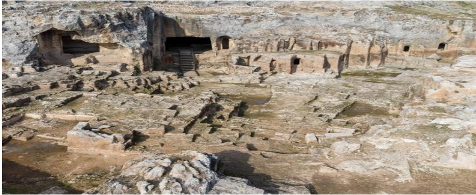
Görsel 3. Hilar Mağaraları Genel Görünüş

Hilar antik kenti, Ergani'nin güneyinde yer alan Hilar Köyü'nün doğusundaki karstik alanda bulunmaktadır. Burada kayaların içine oyulmuş son antik çağlara ait mezarlar, kabartmalar ve Sami dilinde yazılmış yazıtlar vardır (Çambel, 1974: 36).