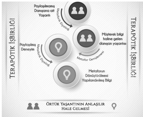
Şekil 1. Terapötik İşbirliği Çerçevesinde Metaforik Süreç

Terapötik süreçte metaforların kullanılması empati, saygı ve psikolojik danışman'ın uzmanlığını olumlu yönde etkilemektedir (Suit ve Paradise, 1975). Etkili metafor kullanımı paylaşılan fenomenolojik gerçekliğe (Mills ve Crowley, 1986) dayanmaktadır. Metaforun, psikolojik danışman ve danışan arasındaki empatik ilişkinin bir parçası haline gelmesi beklenmektedir (Lyddon, ve ark., 2001). Terapistin ürettiği metafor yoluyla, çocuk metafordaki detaylar, karakterler ve olaylarla kendi yaşadıkları arasında bir özdeşim mekanizması kurar. Özdeşim mekanizması kurulduktan sonra, çocuğun yaşadığı sorunla ilgili olarak hissettiği yalnızlık duygusu azalır, durum paylaşılmış deneyim haline döner ve anlaşılabilirlik hissi artar (Mills ve Crowley, 1986). Terapötik işbirliği çerçevesinde metaforik süreç Şekil 1'de sunulmuştur.