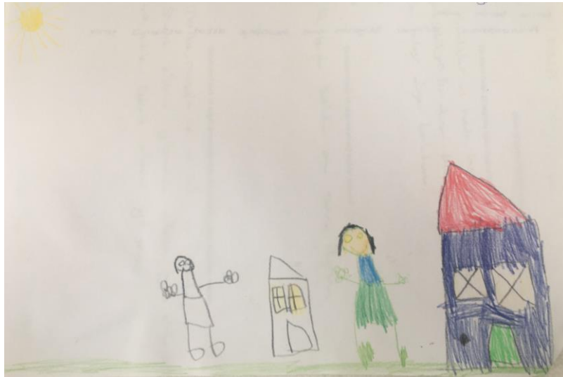
Resim 3: “Mesafe zorunluluğu” temasına yönelik çizim (Ç9)

Resim 3 incelendiğinde pandemi döneminde yaşanan değişimlerin çocukların algısına yönelik olarak resmi yapan çocuk (Ç9) çizdiği resmi “Burası benim evim korona virüsten dolayı mahalledeki arkadaşlarımla görüşemiyorum, sarılmak istiyorum ama sarılamıyorum.” şeklinde anlatmıştır.