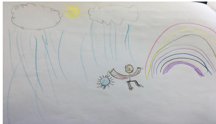
Resim 1: “Duygu durumları” temasına yönelik çizim (Ç4)

Çalışma kapsamında veya bu araştırma kapsamında “COVID-19 virüsü” denilince akla ilk gelen şeyin ne olduğunu ve çizdikleri resim yorumlarının ortak dağılım sonuçları kapsamında %27,58’i maske takma zorunluluğu, %27,58’i Kısıtlanma (Dışarı çıkamama, şehir değiştiremememe, alışveriş merkezine gidememe, okul değişikliği vb.), %20,68’i Duygu durumları (Korku, kaygı ve üzüntü), %17,24’ü Mesafe zorunluluğu (Sarılamamak, grup etkinlikleri vb.), %3,44’ü yoğun market alışverişi, %3,44’ü yoğun temizlik kavramları üzerinde yoğunlaştığı görülmektedir. Çocukların çizmiş oldukları resimler ve yorumları incelendiğinde kısıtlamalar kapsamında sokağa çıkma yasaklarının çocukları etkilediği belirlenmiştir (Resim 1). Çocuklardan birisi (Ç4) çizdiği resmi anlatırken “Hafta sonları korona virüsten dolayı dışarı çıkamadığım için üzgünüm” ifadesini paylaşmıştır.