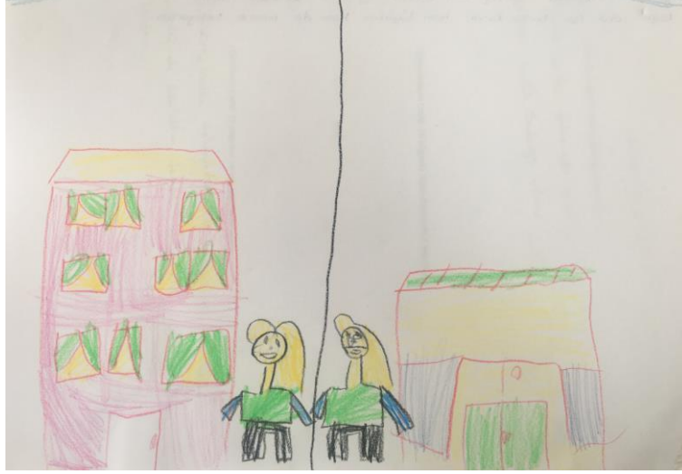
Resim 4: “Kısıtlanma” temasına yönelik çizim (Ç2)

Resim 4'te pandemi döneminde okul değişimi yaşayan çocuğa ait çizim görülmektedir. resmi yapan çocuk (Ç2) yaşadığı değişimi “ Korona virüsten dolayı okulumu değiştirmek zorunda kaldım. Eski okulumda maske takmıyordum. ” şeklinde açıklamıştır.