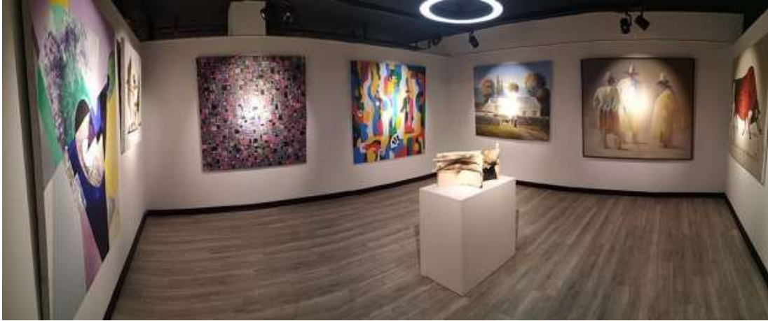
Şekil 5: Günsel Sanat Müzesi Aydınlatma Tasarımı (Serkad H. Işıkören, 2020)

Tüm bu koşullar için büyük önem taşıyan aydınlatma üniteleri de Günsel Sanat Müzesinde çağdaş müzecilik anlayışına uygun olarak kurgulandığı gözlemlenmektedir. Eserleri algılamada etkili olan aydınlatma üniteleri sergi dolaşımında ana hatları aydınlatan bir orta aydınlatma ve eserleri daha fazla ortaya çıkaran taşınabilir spot aydınlatma üniteleri ile iki aşamalı bir aydınlatma tasarımı sunmaktadır (Şekil 5).