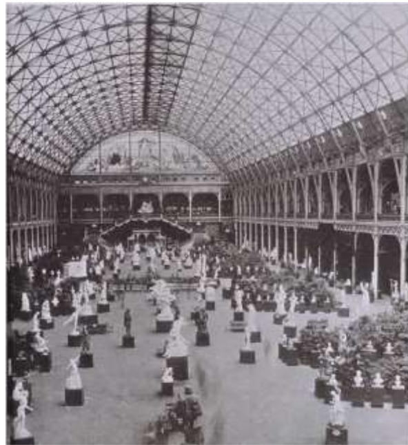
Şekil 3: Salon des Refusés - Reddedilenler Sergisi

18. yüzyılda monarşik rejimlerin terk edilmesi ile kraliyet sarayları sergi mekanına dönüşürken kraliyet arşivleri bu mekanları veya bu anlamda düzenlenen yeni mekanları dolduran sergiler haline gelirler. Bunların en iyi örnekleri Fransa'daki Louvre müzesi ve İngiltere'de British Museum sayılabilir. 20. Yüzyıl öncesi Sanayi devrimi ile başlayan yeni yaşam düzeni, sanatı, dolayısı ile sergi mekanı tasarımlarında etkilemiştir. Ancak 20. Yüzyıl öncesi bu yaklaşım genellikle sanat eserlerini toplama, koruma ve kronolojik sırayla sergileme prensibine dayanır, mekan tasarımının önceliği bu anlamda bu mekanlarda görülmez. Kristal Saray'la (Chrystal Palace) başlayan yeni ve bağımsız sergiler modern sanatın öncüleri ile Akademik baskılardan uzak sanat anlayışı, yeni ve alternatif sergi mekanlarına olanak tanımıştır. Reddedilenler sergisi (res.3) özel izinle Salon tarafından reddedilen sanatçıların bağımsız olarak halka açık bir sergide sanat eserlerini izleyici ile buluşturan alternatif mekanlar olarak adlandırılabilir. 20. Yüzyıl Avrupa sanatının ve Sanat anlayışının, sergileme mekanlarının kronolojik düzenleme ve koleksiyonculuktan çok eserlerin sergileme mekanlarının estetik kaygısına yer verdiği görülmektedir.