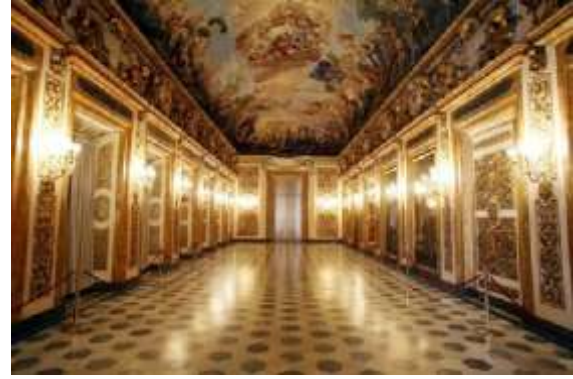
Şekil 2: Palazzo Medici ( http://visittuscany.com/amp/en/medici-riccardi-palace )

18. yüzyılda monarşik rejimlerin terk edilmesi ile kraliyet sarayları sergi mekanına dönüşürken kraliyet arşivleri bu mekanları veya bu anlamda düzenlenen yeni mekanları dolduran sergiler haline gelirler. Bunların en iyi örnekleri Fransa'daki Louvre müzesi ve İngiltere'de British Museum sayılabilir. 20. Yüzyıl öncesi Sanayi devrimi ile başlayan yeni yaşam düzeni, sanatı, dolayısı ile sergi mekanı tasarımlarında etkilemiştir. Ancak 20. Yüzyıl öncesi bu yaklaşım genellikle sanat eserlerini toplama, koruma ve kronolojik sırayla sergileme prensibine dayanır, mekan tasarımının önceliği bu anlamda bu mekanlarda görülmez. Kristal Saray'la (Chrystal Palace) başlayan yeni ve bağımsız sergiler modern sanatın öncüleri ile Akademik baskılardan uzak sanat anlayışı, yeni ve alternatif sergi mekanlarına olanak tanımıştır. Reddedilenler sergisi (res.3) özel izinle Salon tarafından reddedilen sanatçıların bağımsız olarak halka açık bir sergide sanat eserlerini izleyici ile buluşturan alternatif mekanlar olarak adlandırılabilir. 20. Yüzyıl Avrupa sanatının ve Sanat anlayışının, sergileme mekanlarının kronolojik düzenleme ve koleksiyonculuktan çok eserlerin sergileme mekanlarının estetik kaygısına yer verdiği görülmektedir.