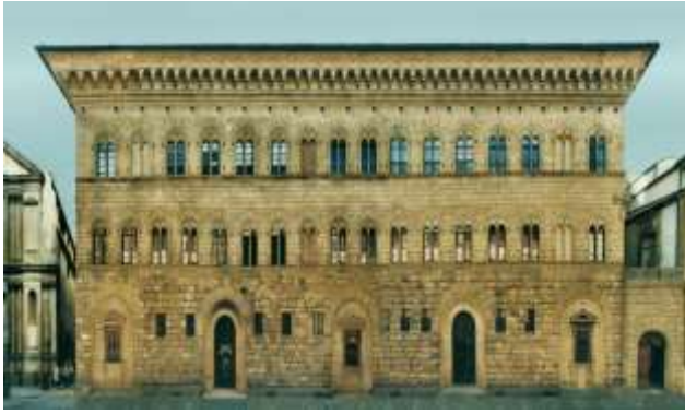
Şekil 1: Palazzo Medici ( http://ecegunal.wordpress.com/2016 )