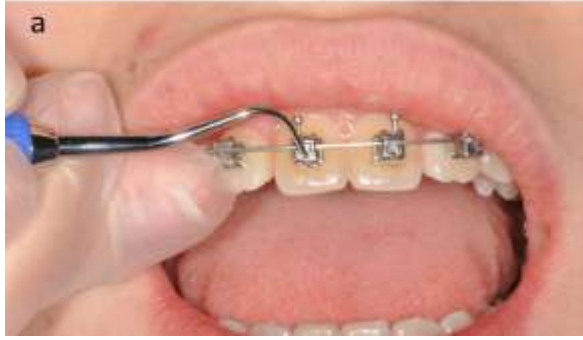
řekil 3. Damon braketleri tweezer ile: a. açma; b. kapama

wire tekniđi, süper elastik NiTi teller ile pasif SL braketlerin birlikte kullanımı prensibine dayanmaktadır. Damon, ark telleri tarafından oluşturulan hafif kuvvetlerin dudak kaslarının üstesinden gelemeyip posterior ekspansiyona sebep olduğunu savunmaktadır. Yapılan arařtırmalarda orbicularis oris ve mentalis kaslarının 'lip bumper' etkisi yaratarak anterior dişlerin proklinasyonunu engellediđine ve posterior segmenti de genişlettiđine vurgu yapılmıřtır (17).