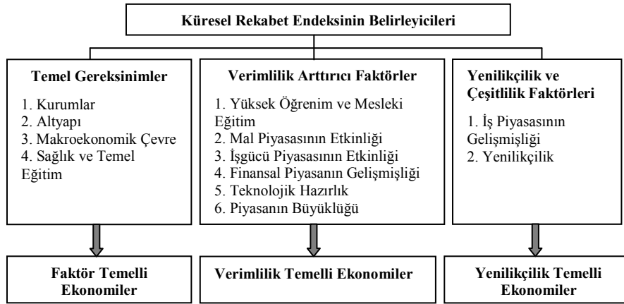
Şekil: 1 Küresel Rekabet Endeksinin Belirleyicileri