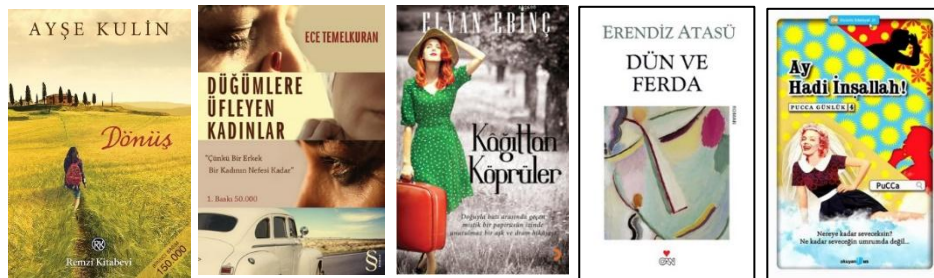
Resim 1 Kitap Kapak Tasarımları