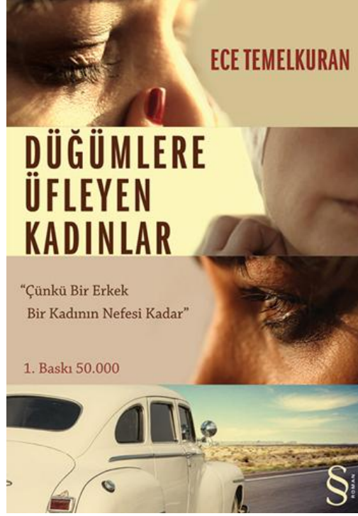
Resim 3: "Düğümlere Üfleyen Kadınlar" Kitap Kapak Tasarımı

Kapakta yer alan "Çünkü bir erkek, bir kadının nefesi kadar" sözü kitabın aslında yoğun bir feminen tarafının olduğunu göstermektedir. Ayrıca Ece Temelkuran kitabın arka kapağında Ortadoğu'da geçen bu roman için şunları da söylemektedir: "Saraylar devrilip meydanlar dolarken sorular kalıyor geriye. Her yola en az bir soruyla çıkılır çünkü: Bir kadın ya da bir ülke nasıl sevilir sahiden?"