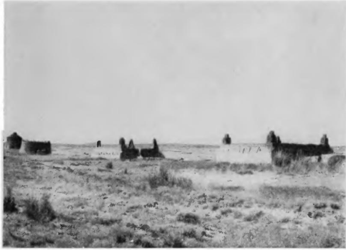
KIRGHIZ MOGHILAS, OR TOMBS For the poor man, simple walls

Fell, E. Nelson (1916). Russian and Nomad , London, s.10.