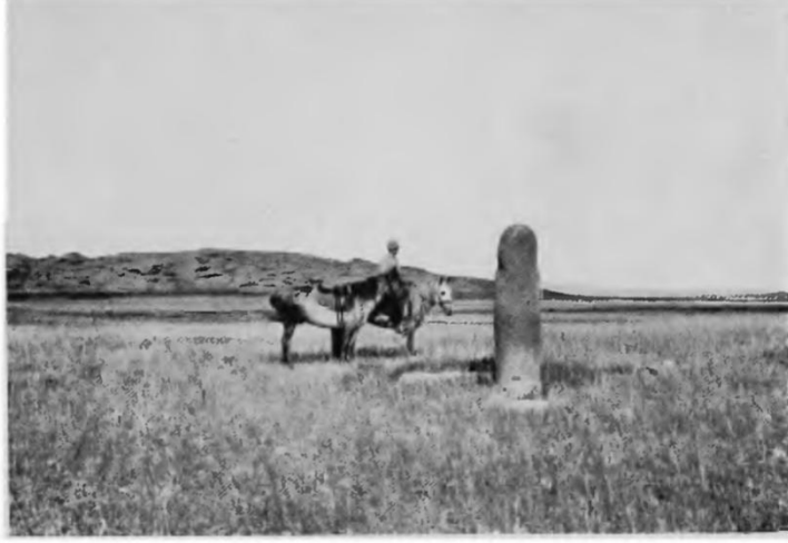
A PREHISTORIC MONUMENT OF STONE