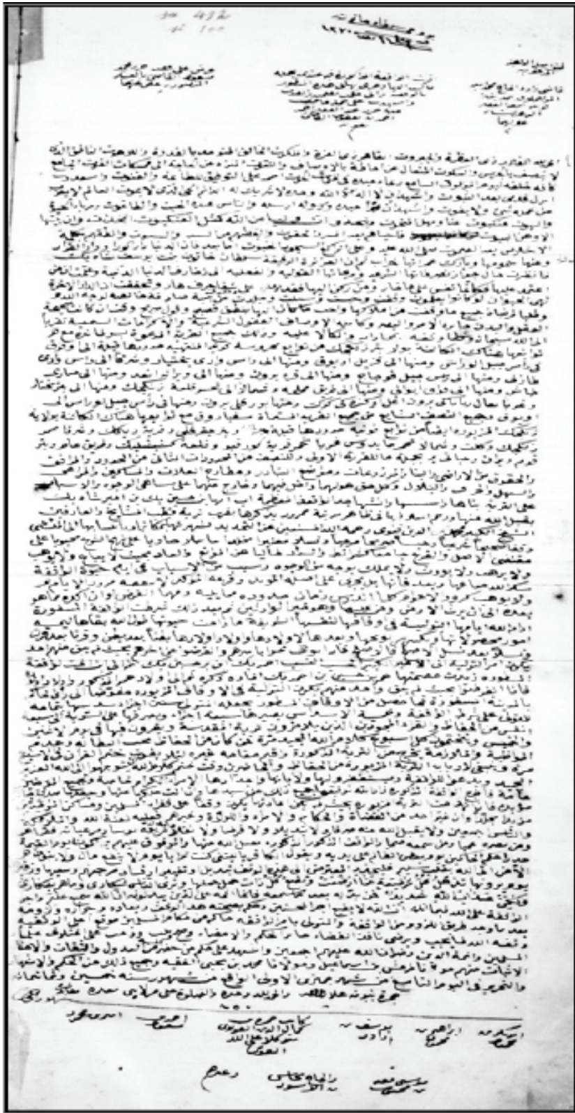
Ek 1: Sultan Hatun'un 1446 Tarihli Vakfiyesi Sûreti (VGMA, d. 582/1, 237:166)