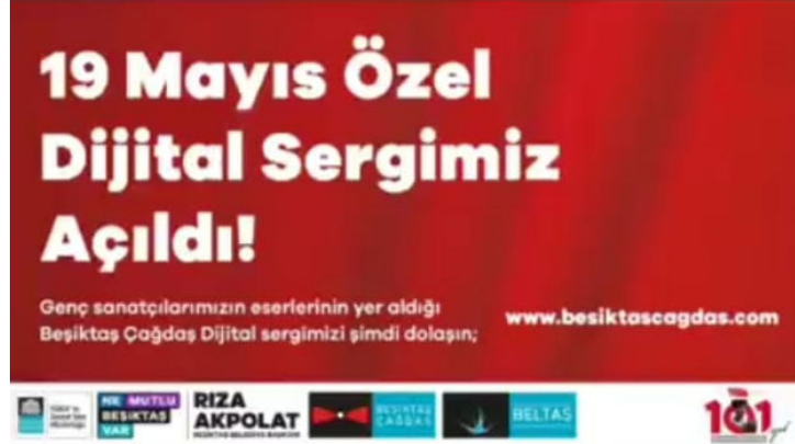
Görsel 2. 19 Mayıs'ın 101. Yılına Özel, Beşiktaş Çağdaş Dijital Sergisi(2020)

Filmmor Kadın Filmleri Festivali, İşçi Filmleri Festivali online gösterim yapan festivaller arasında sayılabilir (Pandemi eşiğinden Sonra Sanat, 2020).