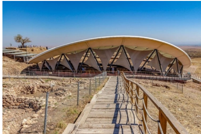
Görse1 6. Göbeklitepe Şanlıurfa sanal müze

Salgınla beraber değişen toplumsal düzene uyum sağlayan sanatçılar, her koşulda sanatsal üretimlerine devam etmekte ve onları sergileme çözümleri üretebilmektedirler. Online sergilerin yanında sanal müzelerde ücretsiz erişime açılmıştır. Birçok farklı müzelere online erişim sağlanabilmiştir. Bunlardan biri de Şanlıurfa'da bulunan göbekli tepedir.