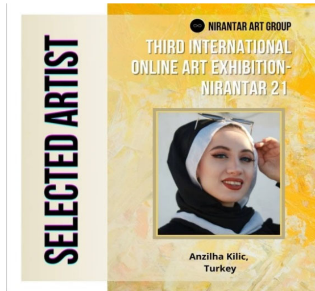
Görsel 3. Nirantart art group, Third international online art exhibition nirantar 21

Sanatçıların kimisi yasaklardan kimisi ise Covid19 hastalığına yakalanmamak için uzun bir süre evde kalmayı tercih etmişlerdir. Bu zaman zarfında ertelenen sergiler ve kamusal alanda yapılan etkinlikler dijital ortamda sergilenmeye başlanmıştır. Bu da dönemin koşullarının getirdiği bir mecburiyet olmuştur. Online sergilerinin dijital ortamlarda sergilenmesi kamusal sanat mekân algısını da değiştirmiştir diyebiliriz. Kapalı alanlarda sergi açmak bu kısıtlı dönem için tehlikeli ve yasak sayılmıştır.