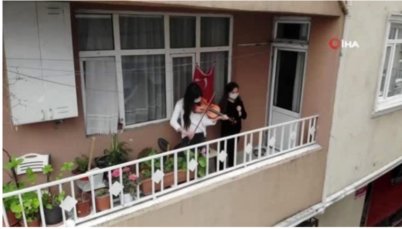
Görsel 1. Zeytinburnu'nda balkona çıkıp keman çalan kadın (İstanbul, 2020)

Ülkemizde karantina altında sıkılan insanların balkonlarında şarkı söyleyerek ve dans ederek bir performans sergilemişlerdir. Birçok farklı ülkede balkonlarından müzik yapan sanatçıların performansları da bu durumu destekler niteliktedir. (bkz. Görsel 1).