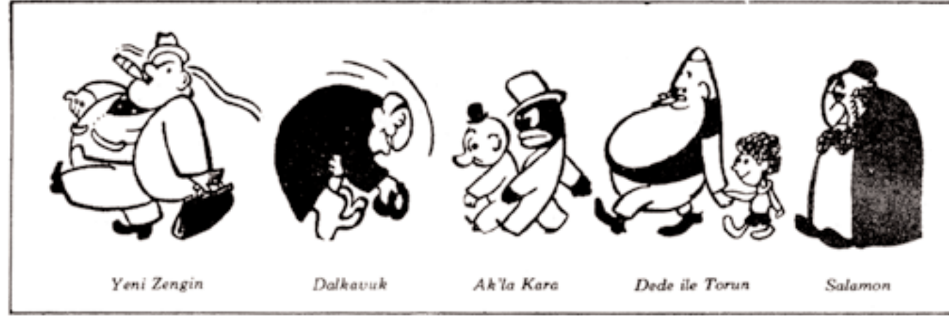
Şekil 5 - Cemal Nadir'in tipleri

kadınların ve fötr şapkalı, devasa göbekli erkeklerin dünyasıdır (şekiller: 1, 2, 3, 4, 5). Siyasi bir sistem olarak görünüşte çökmüş olan Osmanlı, toplumsal yaşamda varlığını bütün gücüyle sürdürmekte, üstelik buna ulusal, merkezi devletçi yapı ve İkinci Dünya Savaşı'nın getirdiği ekonomik durgunluk ve yokluklar eşlik etmektedir. Cemal Nadir bu dünyayı gayet iyi tanımaktadır: