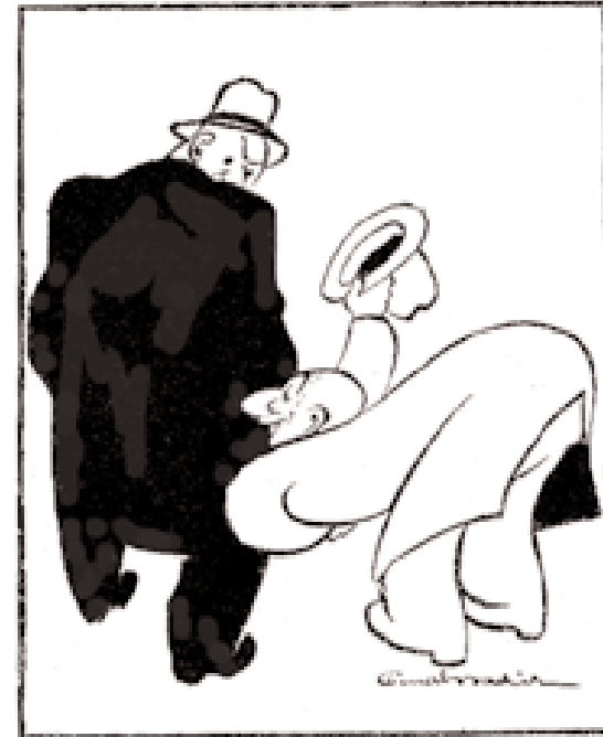
Şekil 2 - Hadi oradan odun Herif! - Teveccühünüz efendim!"

diğinde Türk karikatür sanatının ilk büyük ustası olarak kabul edilen, Cumhuriyet öncesi çizerlerinden ressam Cemil Cem'in büyük etkisi açık bir şekilde görünür. Cem'in etki ve esin kaynağı ise on dokuzuncu yüzyılın ünlü Fransız karikatür çizeri Carand'ache'dir. Bu isim, zamanın çizerleri arasında 'Karındaş' olarak, dilimize uygun hale getirilerek kullanılmakta ve çok sevilmektedir. 'Carand'ache üslubu karikatür', temelde figür ve perspektifin alabildiğine abartıldığı, figürlerin dış çizgilerinin oldukça kalın tutulduğu bir karikatür üslubudur ve esas kaynağı daha da eskilere, Leonardo Da Vinci'nin bin beş yüzü yıllarda yaptığı çizimlere kadar gitmektedir. Çizgilerin kalın ve koyu olmalarının nedeni baskı teknolojisinin dikte ettiği bir zorunluluktur aslında. Türkiye'de gazeteler, yetmişli yılların başlarına kadar klişe baskı tekniği ile basıldıkları için, karikatürler önce kalın kesik uçlu kalemle kâğıda çizilmekte, sonra bunların çinko kalıpları hazırlanmaktaydı. Yani, karikatür figürlerinin dış çizgileri ne kadar kalın olursa, seri baskı sırasında kâğıda geçme şansları o kadar yüksek olmaktadır. Zamanla bu kesik uç yöntemi gazete ve dergilerde, fotoğrafik ofset baskı sistemine geçilmesi ile birlikte artık gereksiz olduğu halde estetik bir kaygı ile göze hoş görüldüğü için devam ettirildi ve hala da sürdürülmekte-