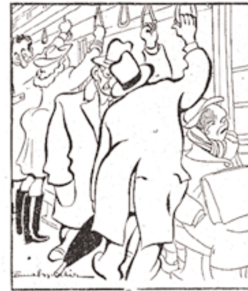
Şekil 3 Bir yolcu: Biri kalkar da yerine otururum diye beklemekten dizlerime kara su indi birader Bir mebus namzedi: O da bir şey mi yahu, ben onu dört yıldır bekliyorum.

Cemal Nadir, karikatürlerinde gündelik yaşamın traji-komedisini birbirlerinden ayrılması olanaksız bir insan-mekân ilişkisi içerisinde ele almıştır. Nadir, çizimlerinde mekâna yukarıdan yaklaşır. Karikatür tipleri sanki içinde yaşadıkları mekâna gömülmüş gibidir. Hareket ögesi en aza indirgenmiştir. Jest ve mimiklere bir yapaylık, bir ezilmişlik duygusu egemendir. Tipler sanki katlanmakta zorluk çektikleri bir ağırlık altında eziliyor gibidirler. Her şey; eşyalar, insan ve hayvanlar garip bir tenhalık, bir boşluk içindedirler. Perspektif, diyağonal ve neredeyse ileriye doğru giderek bükülmektedir. Küçük, ev içleri kasvetlidir. Duvarlardaki resim çerçeveleri, aynalar, soba ve iskemleler genellikle yamuk yumuktur ve eskiliktен dökülmektedirler. İnsan tipleri, iç mekâna oranla oldukça iri, sanki ev içlerine sığamamış gibi çizilmiştir. Bunlar genelde şişmandır. Hep otururlar. Ellerindeki sigaranın dumanı bile sanki havada asılı kalmış ve sonsuza kadar donmuştur. Bu dünya, ağırlıklı olarak devlet babanın, bürokratların, yeni taşralı zenginlerle savaş karaborsacılarının, aşırı makyajlı şişman