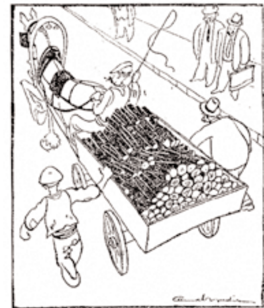
Şekil 4 Saltanat arabası