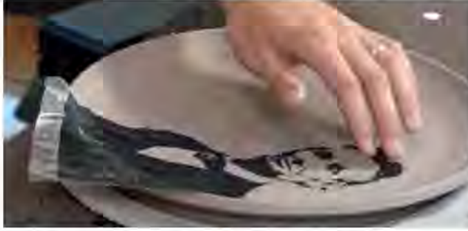
Resim 11. Justin Rothshank, Yaş Bünye Üzerinde Çıkartma Uygulaması.

basılan görüntü daha sonra sprey ya da elek yöntemiyle lak ile kaplanmaktadır. Eğer basılan kâğıt laklı çıkartma kâğıdı ise çıktı alındıktan sonra çıkartma yüzeye transfer etmek için hazır olmaktadır. Bu yöntemde kullanılan lazertran kâğıdı lazer yazıcı ya da fotokopi makinası mürekkepleriyle kullanılmak üzere üretilmiş özel bir üründür ( http://www.lazertran.com ). Bilinen klasik yöntemle sırlı yüzeylere uygulanabilen bu tür çıkartmalar 200 C'de pişirilebilmektedir.