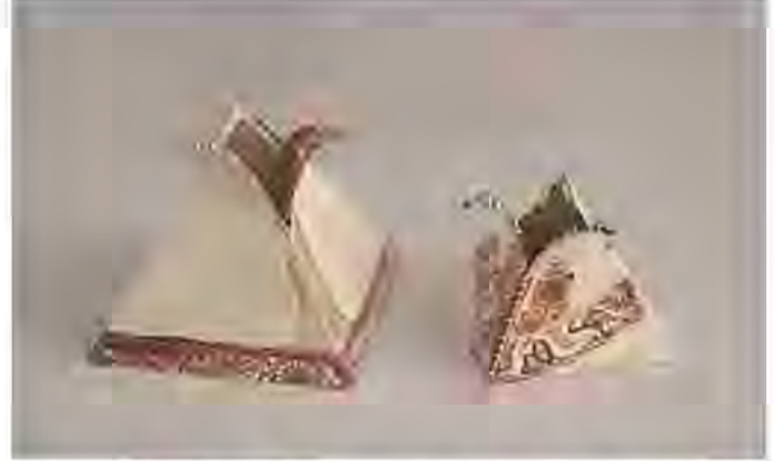
Resim 9. Sibel Sevim, Stoneware, Piramit formlar üzerinde Çok Renkli Çıkartma Uygulaması.

Sibel Sevim'in formları üzerinde vazgeçilmez dekor