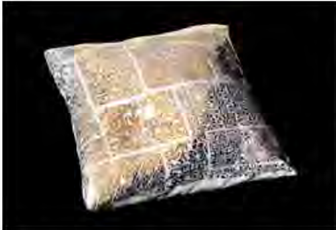
Resim 8. Zehra Çobanlı, Altın Yıldız Çıkartma Uygulaması.

Çıkartma tekniğinde kolaj yaklaşımının kullanım eşyaları dışında artistik seramik formlarda da etkili biçimde kullanıldığı görülmektedir. Bu tekniği özgün biçimde kullanan seramik sanatçıları arasında bulunan Zehra Çobanlı'nın çalışmalarında kullandığı geleneksel çini desenlerinin renk ve biçim olarak orijinalliğini koruduğu dikkat çekmektedir. Sanatçı, farklı biçimlerde kesilen çıkartma desenlerinin yeniden bir araya getirilmesiyle yeni öneriler sunmaktadır.