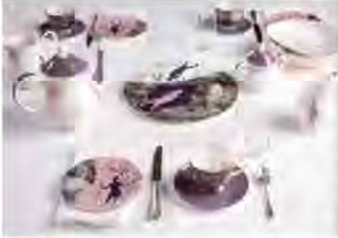
Resim 7. Charlotte Hodes, Elden Kesilmiş Çıkartmalarla Dekorlanmış 14 Parça Yemek Takımı.

yaklaşımların yanı sıra sofraya eşyaları gibi günlük hayatımızın parçası olan işlevsel formlarda bile özgün bir estetik sunmaktadır. Bunun için renk ayrımı yapılarak her renk için ayrı baskı gerçekleştirilmektedir (Quinn, 2007:64).