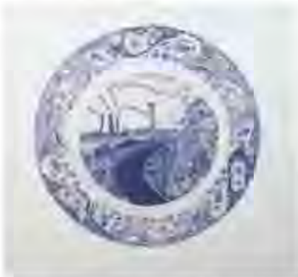
Resim 4. Paul Scott, 1997, Bone China Üzerine Sırıçi Çıkartma Uygulaması.

Paul Scott, seramik yüzeylerde baskı tekniklerinin uzmanı ve çıkartmayı birçok uygulamasında kullanan bir çağdaş seramik sanatçısı olarak seramik ve baskı alanındaki