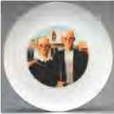
Resim 3. Howard Kottler, Benzerleri, 1972, Porselen Üzerine Çıkartma.

1960-70'lerde çağdaş seramik uygulamalarının da popüler bir dekor yöntemi haline gelen çıkartma tekniği, endüstride elek baskı tekniğiyle seri dekor uygulamalarında yaygınlaşırken, seramikçiler tarafından da kolaj malzemesi olarak tercih edilmeye başlanmıştır. Bu tekniği, özgün şekilde tüm çalışmalarında kullanan ve farklılıklarla gelişmesini sağlayan sanatçıların isimleri de bu teknikle özdeşleşmiştir. Konu ile ilgili çalışan sanatçılardan örnek verecek olursak, sanatsal çalışmalardaki çıkartma tekniğine ilk kez Howard Kottler'in eserlerinde rastlanmaktadır.