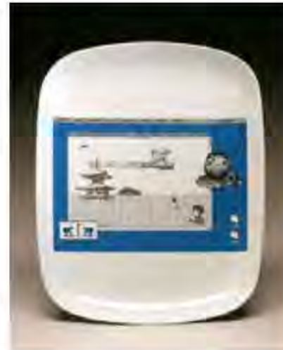
Resim 13. Scott Rench, Dijital Baskı.

Dijital olarak basılan çıkartma desenlerinde mürekkep kalınlığı ve yoğunluğu daha az tutulduğundan, daha açık ve solgun etkiler vermektedir. Serigrafide yapılan baskı daha doygun bir boya tabakası oluşturarak çıkartmanın seramik yüzey üzerindeki etkinisinin daha koyu ve kalın bir katmana dönüşmesini sağlamaktadır.