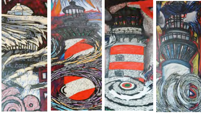
Resim 2 Resim 4 Resim 5 Resim 9

Resimlerdeki deniz feneri ve diğer göstergeler tek