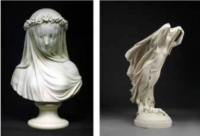
Resim 8. Rafaella Monti'nin Copeland firması için modellediği 'Gelin' (solda- yükseklik 38 cm) ve 'Gece' (sağda- yükseklik 46,6 cm) isimli heykelleri.