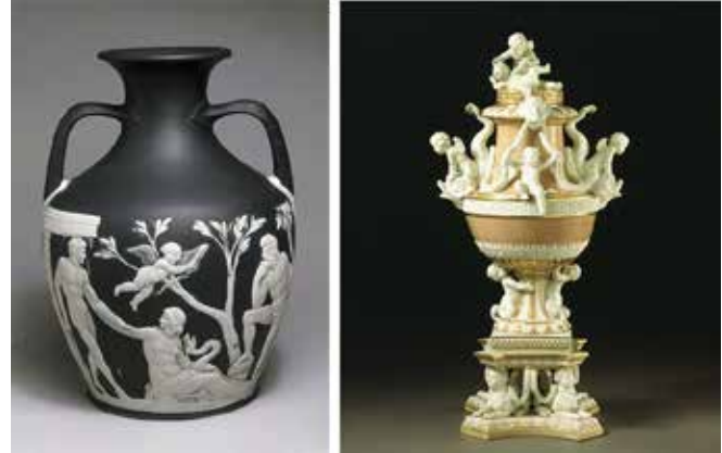
Resim 3. Victoria & Albert Müzesi koleksiyonundan Neoklasik üslupta yapılmış Wedgwood markalı 'Portland Vase' ve Derby Porselen Fabrikası'na ait figürlü vazo.

Bu akımın Britanyalı porselen üreticilerine etkileri incelendiğinde; Avrupa'nın diğer üreticilerinde olduğu gibi saplantılı bir biçimde ve geniş bir skalada Neoklasik vazo üretimi yapıldığı görülmüştür. Özellikle şömine rafı süsü olarak tabir edilen ve o dönemde çok moda olan Neoklasik üsluptaki ev dekorasyon ürünlerinin üretiminde Bow, Chelsea, Derby ve Wedgwood fabrikalarının çekişmesi ön plandadır. Özellikle bu fabrikalardan çıkan yapıtlar günümüz müze koleksiyonlarının önemli parçalarındandır (Resim 3).