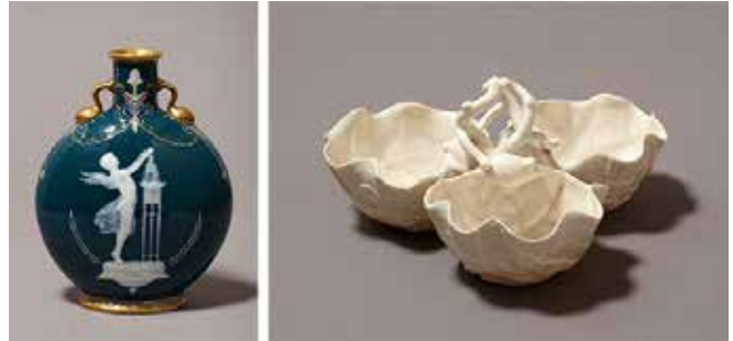
Resim 6. Louis Solon imzalı, pâte-sur-pâte tekniğinin uygulandığı altın yaldızlı şişe (1875) ve Belleek firmasına ait deniz kabuğu biçimli lüsterli Parian kâseleri (1868).

sırlıdır. 8 Bünyeler genellikle mermersi, pürüzsüz bir dokudadır ve bisküvisi saf beyaz görünümündedir...". Cameron, Parian 'ismini' kullanan ilk şirketin de Minton olduğunu belirtir. Parian porselen bünyesi ilk olarak figür heykeli ve grupları için daha sonraları ise sıklıkla sırlı porselenlerin merkezinde dekoratif unsur olarak kullanılmıştır. Minton bu dönemde Marc-Louis Solon'un Parian porselen bünyesini geliştirerek pâte-sur-pâte 9 tekniğinde uyguladığı sert porselen bünyelerde bol miktarda altın yaldızlı yemek takımını üretmiştir. 1840'larda aynı zamanda Parian bünyenin bir versiyonu olan sert porselen bünye ile de benzer işler üretilmiştir. Belleek Fabrikası her iki bünyeyle de ürünler veren ilk firmadır ve devamında da yanardöner sırlı benzer bir bünye üretmiştir (Resim 6). 1890'lardan sonra İngiltere'deki üretimin azalmasına rağmen Robinson & Leadbeater yirminci yüzyıla kadar üretimini kesintisiz sürdürmüştür. Diğer Avrupalı üreticiler Rörstrand ve Gustavsburg fabrikalarıdır (Cameron, 1986: 225).