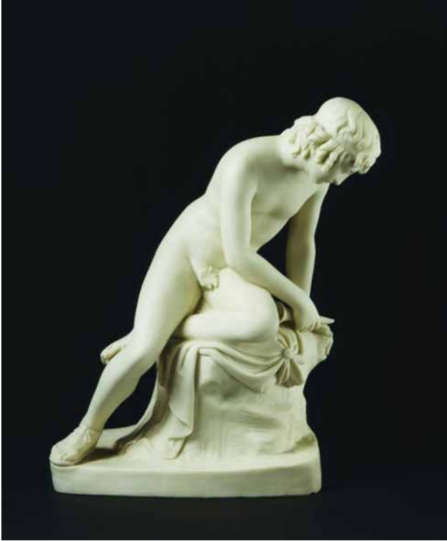
Resim 7. John Gibson'ın Copeland firmasında üretilen ünlü Narkisos heykeli. 30,2 x 24,2 cm. 1846