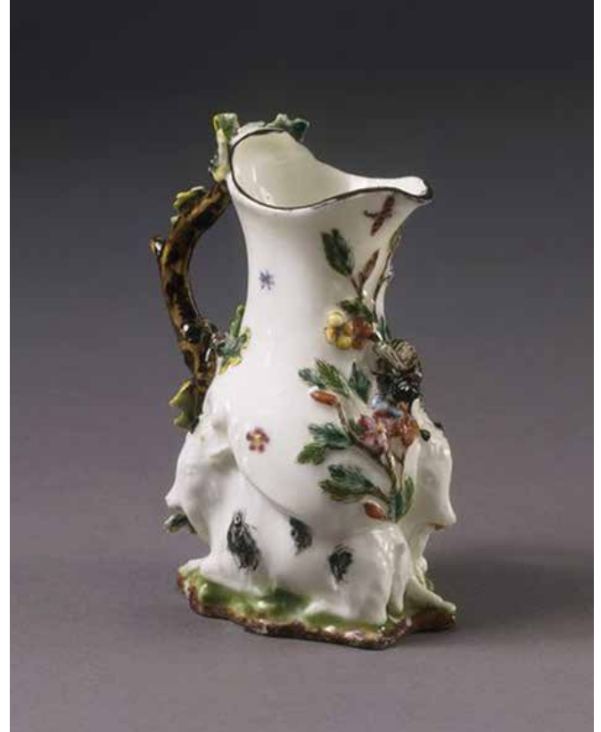
Resim 1. ‘Keçi ve arı’ sürahi. Chelsea Porselen Fabrikası’nda yumuşak porselen bünyeye 1745 yılında üretilmiştir. Emaye dekorlu eserin tasarımcısı Nicholas Sprimont’tur.

lan Chelsea’deki fabrikada ilk porselen üretimi gerçekleştirilmiştir. 2 Yumuşak porselen bünyelere sahip bu ürünlerin en büyük özelliği hem figüratif öğelere sahip oluşları hem de kullanım amaçlı olarak tasarlanmış olmalarıdır (Resim 1). Sadece figüratif amaçla tasarlanmış porselenler sayıca daha azdır. Özellikle 1760’larda yapılmış olan figür grupları ve vazolar detaylarla donatılmış, renkli ve Sévres tarzı altın yaldızlıdır. François Boucher’ın gravürlerinden öykünerek yapılan ‘Müzik Dersi’ ve ‘Dans Dersi’ isimli porselen heykeller bunlar arasında en göze çarpan ve dönemi iyi yansıtan örneklerdir. 1750’de Derby’de kurulan fabrika Chelsea’deki porselen fabrikasının ürettiği heykellere rakip olacak kalitede porselen figürler üreten önemli üreticilerdendi. Bu fabrika, o dönemin modasını yansıtan kıyafetler giymiş, hanımefendi ve beyefendileri veya Rokoko stiline Çin figürleriyle ünlenmiştir (Resim 2) (Coutts, 2001: 142-151).