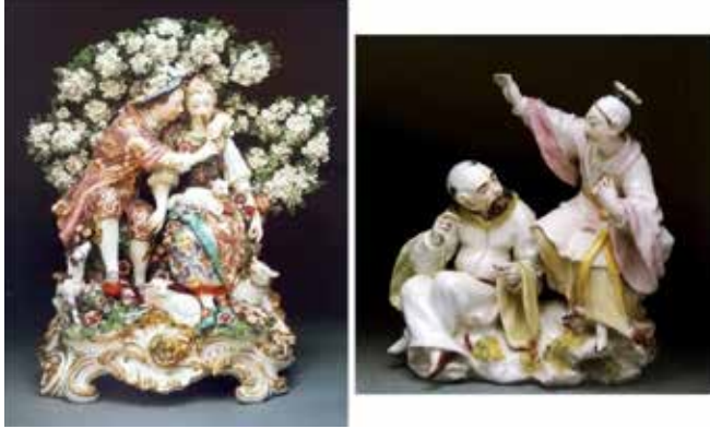
Resim 2. Chelsea Porselen Fabrikası'nda üretilmiş 'Müzik Derisi' isimli ve Derby Porselen Fabrikası'nda üretilmiş Çin figürlü Sévres tarzı porselen figür grupları.

Batı Avrupa sanatında Klasik Sanatın etkileri, on beşinci yüzyıldan on dokuzuncu yüzyıla kadar görülmüş, bu etkiler porselen üretimine de yansımıştır. Bu anlayış, özellikle iç pazardaki talepler doğrultusunda 'klasik üsluptan daha klasik' tarzda taklit eserler ortaya çıkmasını da beraberinde getirmiştir. On sekizinci yüzyılda daha da canlandırılan bu akım bazı yönleriyle eklektik görünmektedir, öyle ki çok geniş bir kaynaktan ilham alan Neoklasizm, toplumunun form ve normlarına uygun, modern yaşam biçimine uyum sağlayacak, eski üsluba ait eserler ortaya koyma girişimindedir. Klasik sanatın yeniden dirilişi 'Aydınlanma' olarak bildiğimiz, on sekizinci yüzyıl düşünce akımlarıyla yakından ilişkilidir. Bu düşünce dünyayı, duygusal veya dini yönden ziyade daha rasyonel ve bilimsel gözleme dayalı olarak anlamayı işaret eden entelektüel ve sosyal bir harekettir. Toplumsal sorumluluk ve vatandaşlık gibi bireysel olgular, kutsal kralla bağlılık ve monarşik yönetimin getirdiği benzeri inançların yerini almaya başlamıştır. Bu sebeple on sekizinci yüzyıldan sonra, Klasik üslubun natüralist özelliği diğer tasarım ürünleriyle beraber porselen üretimine de yansımış ve pervasız olarak tanımlanabilecek aşırı serbest Rokoko üslubuna karşılık klasik dönem sanat disiplini daha üstün görülmeye başlanmıştır (Coutts, 2001: 169).