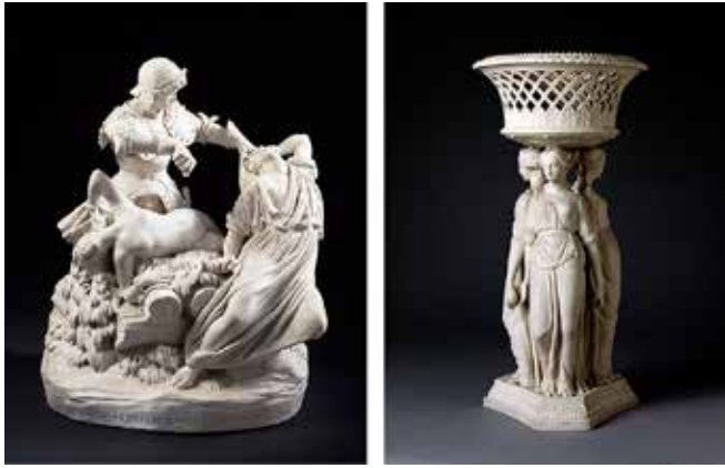
Resim 5. Victoria and Albert Müzesi koleksiyonunda yer alan Coalport Porselen Fabrikası markalı 46 cm yüksekliğinde 'The Faerie Queene' (1852) ve Copeland'a ait dekoratif figürler grubu. (1851)

Parian, çoğunlukla Fransa Sévres'de üretilmiş porselen bisküvi figürlerin geliştirilmesi fikrinden yola çıkılarak üretilmiştir. 6 Bu dönemde yaygın şekilde üretilen bu porselen figürlerin dezavantajları, genellikle, kalın cidarlı, ağır, kırık beyaz renkte pürüzlü bir yüzeye sahip olmalarıydı. Tüm bu dezavantajları Parian bünyesi ortadan kaldırmıştı. Ayrıca yüksek oranda pekişmiş bünyesinin güzelliğinin ötesinde biçimlendirmesi de kolaydı ve bu sayede gerçek gibi görünebilen büstlerin yapımına da elverişliydi.