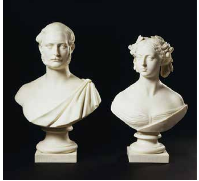
Resim 4. Prens Albert ve Kraliçe Victoria’nın büstleri. 32 x 21,1 x 11,5 cm. ve 29 x 18,3 x 11 cm. Minton & Co. 1862. Victoria & Albert Müzesi koleksiyonu.

güncel kişiliklerin büstleri daha ucuz, doku olarak daha yumuşak, bisküvi diye adlandırılan bünyeden çok daha kaliteli ve mermeri taklit eden görüntüsüyle orta sınıfın da evlerine girmeye başladı (Resim 4).