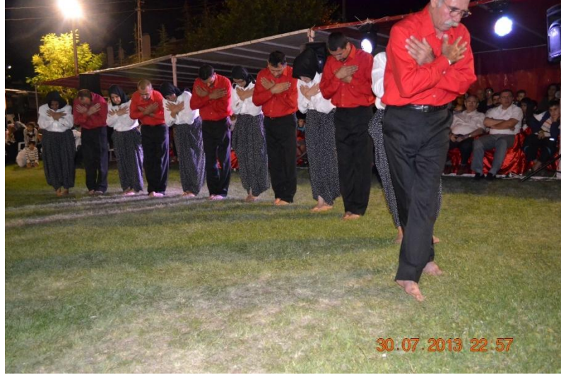
Görsel 3: Dergâhtan Bir Semah Görüntüsü.

Semah, “cemdeki on iki hizmet sıralamasında yer alan, cem ve muhabbet toplantılarında müzik eşliğinde yapılan dini tören” (Korkmaz,1993: 310) olarak nitelendirilebilir.