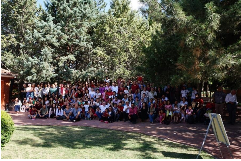
Görsel 4: Yaz Okuluna Katılan Öğrencilerin Dergâh Bahçesinde Toplu Fotoğrafı.

yemek yemeye dikkat edilir. Önemli kararlar alınmaz. Kız isteme, nişan, düğün olmaz. Tırnak kesilmez. Tıraş olunmaz. Banyo yapılmaz. Çamaşır yıkanmaz. Ev temizliği yapılmaz. Eşler birbirine yaklaşmaz. Hiçbir zaman gönül kırılmaz. Akşamları Kerbela olayını anlatan kitaplar okunur. Her gün sabah namazından önce sahurdan sonra zikir çekilir. Mersiyeler söylenir, Hz. Hüseyin'e ağıtlar yakılır. Yedi muharremde, Hz. Hür Gazi'nin, Yezid ordularının komutanı iken Hz. Hüseyin'in saflarına geçmesinin ve şehit olmasının anısına kara helva pişirilir ve komşulara dağıtılır. Oruç o helvayla açılır. Dokuz Muharrem'de sadece yarma kullanılarak çeşitli baklagiller katılmadan sade aşure yapılır. Oruç onunla açılır. Muharrem'in onuncu günü, ikindi namazından sonra da zikir çekilir. O gün pişirilen aşure yemeği ile oruçlar açılır. Bu matem ayının ve oruç tutmanın gayesine gelince İmam Cafer Sadık Efendimizin 'Her yer Kerbela her gün aşura' sözündeki bilince ulaşmaya çalışmaktır. Abdülkadir Sultan'ın bu hususu şöyle dile getirmiştir: "Ramazan orucunu Cenabı Allah emretmiş, 'tutun' diyor. Muharrem orucu ise bizzat emir değil aştır. Mesela Ramazan orucu, namaz kaza yapılır; fakat aşk kaza yapılmaz. Yani Muharrem orucunun kazası yoktur. (KK-2)