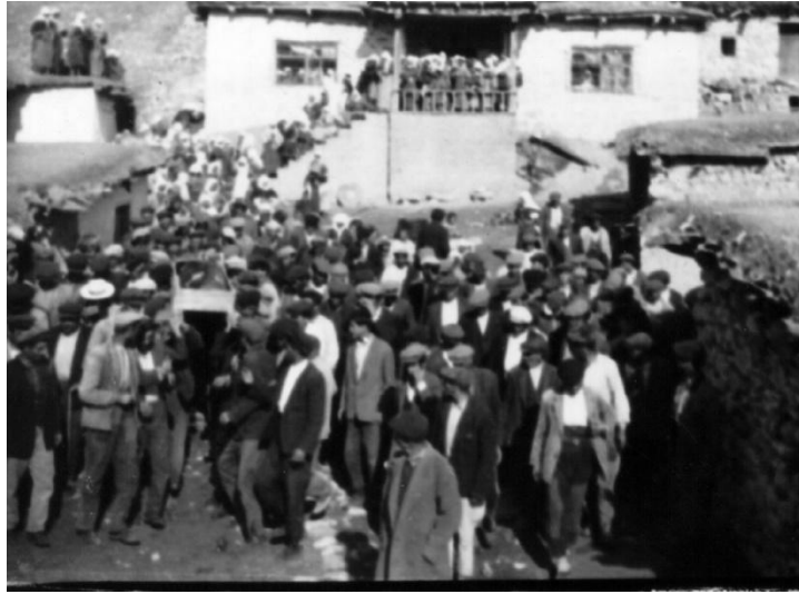
Görsel 5: Zehra Bacı'nın Naaşının Taşınma Görüntüsü.

31 Temmuz 1965 tarihinde vuslata eren Zehra Bacı'yı anma günü de Hak Halili / Zehra Bacı Dergâhı'nın mihenk taşlarındandır.