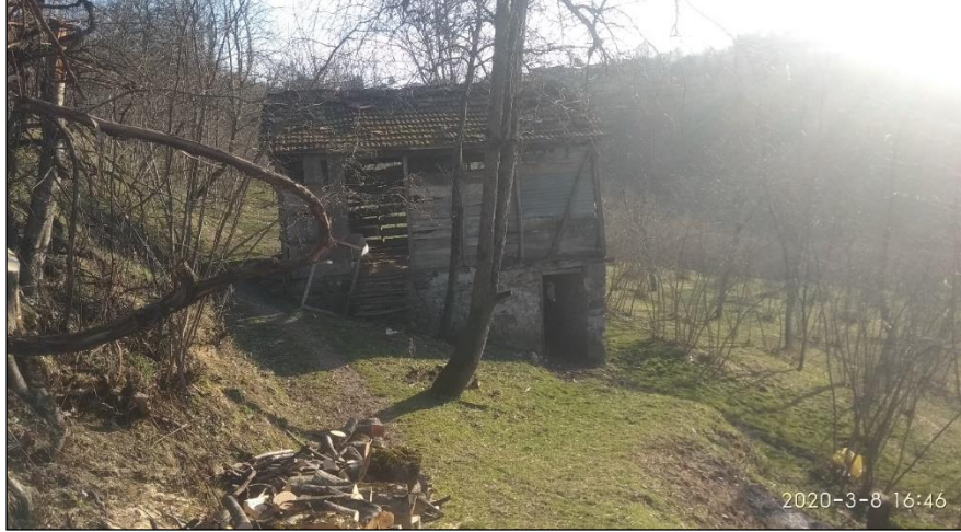
Res. 2. İmam'ın Hüsnü'nün Ordu/Ulubey, Yukarıkızıl Köyü'nde yaşamış olduğu yer.

Çocukluk ve gençlik yılları ile ilgili İmam'ın Hüsnü'yü tanıyanların anlattıklarıyla birtakım bilgilere ulaşılmaktadır. Birinci Dünya Savaşı yıllarında yörenin erkeklerinin çoğu askerde iken bölgede kalan Ermeni eşkıyalarının köylülere yaptıkları zulümler o yıllarda genç bir delikanlı olan İmam'ın Hüsnü'nün gururuna dokunmaktadır. Köyü bu eşkıyalara karşı korumayı kendine vazife bilmiş ve onlarla mücadele etmiştir. Bu mücadelede başarılı olduğu ve eşkıyaların bu yöreye girişine engel olduğu anlatılmaktadır. İyi silah kullandığı ve cesur olduğu için yörede "Mermiyi adamın alnında sınavan Hüsnü" olarak da bilinir (bk. Resim: 2). 2