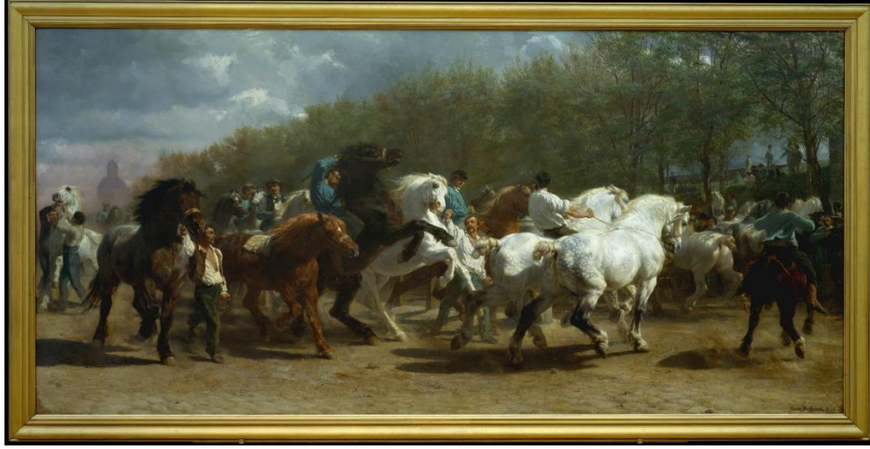
Görsel 1. "The Horse Fair", Rosa Bonheur, 1852-1855.

Fleming, 2015, 642). Leppert'in (2009, 287) de belirttiği üzere, 1970'lere kadar gerek sanat tarihi alanının gerekse sanatsal disiplinlerin neredeyse tamamının kadın ve sanat gibi konulara eğilme ihtiyacı hissetmeyen erkeklerin elinde olması Berger'in sanatta kadının nesnelığı üzerine yaptığı saptamaları boşa çıkarmaz. Aksine, kronolojik olarak bakıldığı takdirde Berger'i tamamladığı söylenebilir.