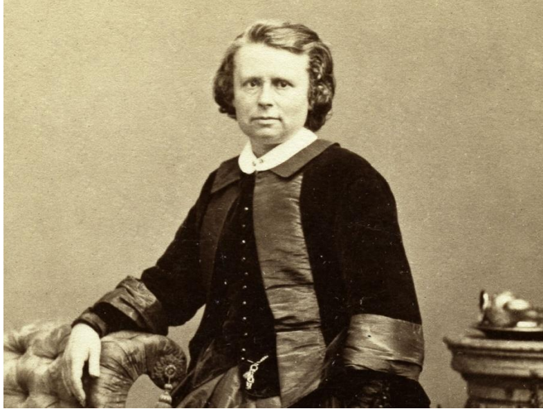
Görsel 2. Rosa Bonheur

insan tabiatı karşısında hüsrana uğradığı bir başka örnekle karşı karşıya olunduğunun anlaşılması uzun sürmez. Bonheur'un sanatına, pek az kaynakta 19. Yüzyıl Gerçekçiliği çerçevesinde kısaca değinilmektedir.