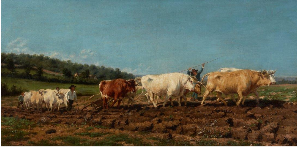
Görsel 3. "Labourage Nivernais," Rosa Bonheur, 1849.