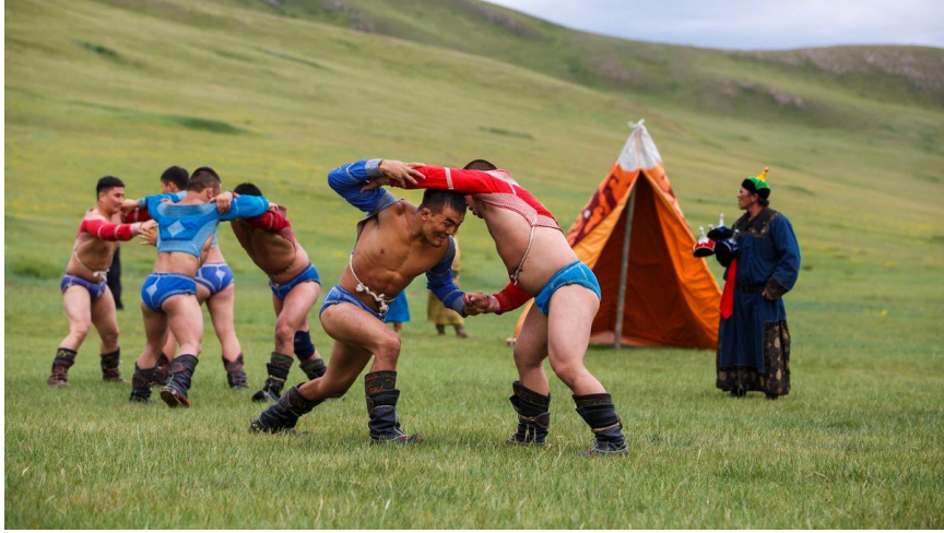
Görsel 4. Geleneksel Bökh Güreşçileri

Yukarıdaki cepkenin önü açık. Çok ilginç bir ceket. Bunun nedenini sorduk. Açıklaması da enteresan, bir efsaneye dayanıyor. Asırlar önce bir müsabakaya katılan bir kadın yarışmacı... Ki o zaman cepkenin önü kapalıymış. Bütün erkek yarışmacıları artarda yere sermiş. Sonunda kadın olduğu ortaya çıkınca, erkekler tabii büyük mahcupiyet yaşamışlar ve cepkenin önü tamamen açılmış ki, kadınlar erkekleri rezil etmesin, mahcup etmesinler diye (Yeşiltepe, 2019).