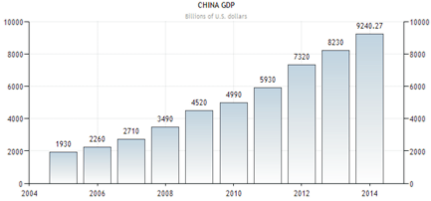
Şekil 1: 2004-2014 yılları GSMH Düzeyi

Kaynak: TradingEconomics (2015), Dünya Bankası (2015)