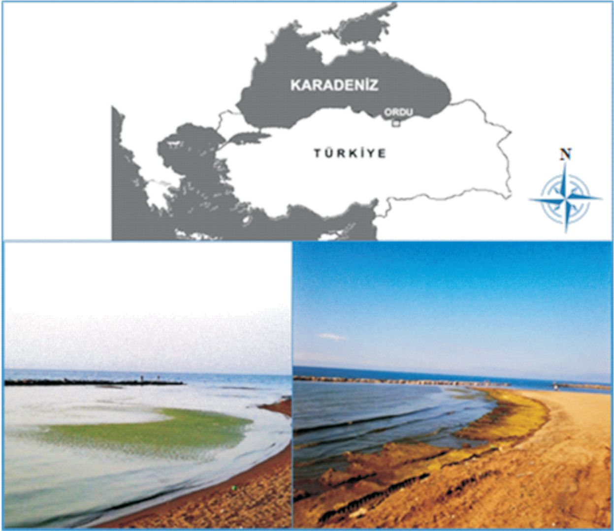
Şekil 2. Araştırma alanının konumu ve genel görünümü.