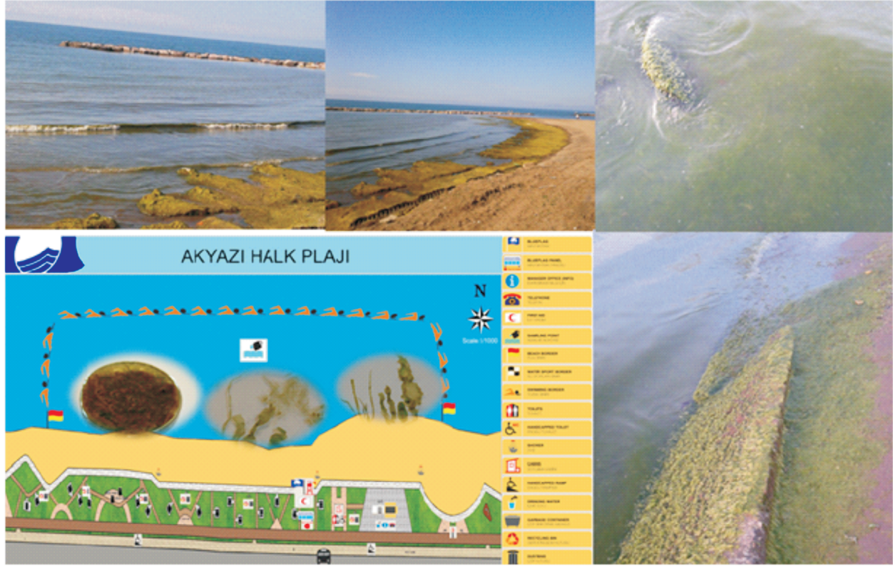
Şekil 3. Plaj alanında yeşil gelgitin genel görünümü.