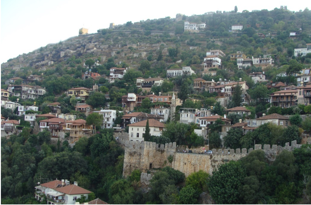
Foto 3. Alanya Kaleiçi halen Selçuklu dönemi yerleşme izlerini taşımaktadır.

Alanya, coğrafi sistematik ve yöntemlere bağlı kalarak doğrudan sahadan ve tarihi kaynaklardan sağlanan bilgi ve verilerle Selçuklu dönemi ve fonksiyon özellikleriyle konu sınırlandırılarak şehir coğrafyası bakımından ele alınmıştır.