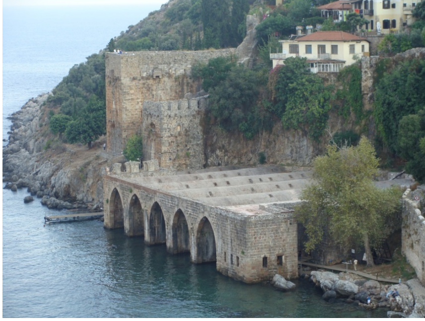
Foto 4. Sultan Alâeddin Keykubâd tarafından yaptırılan Alanya Tersanesi.

takriben 57 m uzunluğunda ve en çok 40 m derinliğindedir (Gürbüz, 2001: 217). Akdeniz'in egemenliğini elde tutan kadırgaların inşası için kurulan tersanede 80-100 tonluk gemiler yapılabiliyordu (Yıldız, 2008: 25).