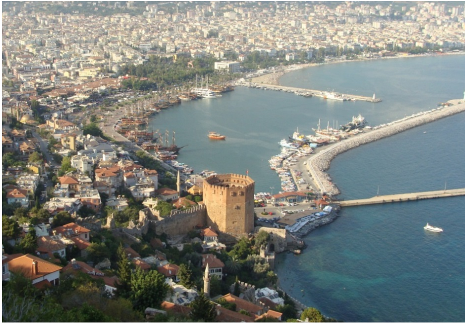
Foto 5. Alanya limanı, Akdeniz'den Anadolu'ya girişte önemli kapılardan biridir.

Deniz Ulaşımı: Ulaşım faaliyetlerinin önemli bir dalı olan deniz ulaşımının şehrin kuruluşu ve gelişmesinde çok önemli bir rolü söz konusudur. Alanya, hinterlandı geniş doğal bir liman olup tersane, emtia depoları vb. tesisler mevcuttu. Bunlar şehrin ekonomik bakımdan gelişimini desteklemekte ve hatta şehrin ekonomisini dönüştürücü bir rol üstlenmektedir. Gerçekten Alanya limanı, Selçuklu döneminde İç Anadolu'nun ve Konya'nın tabii bir limanı ve denizde teneffüs edeceği yegâne iskelesi durumunda idi (Konyalı, 2011: 55). Diğer taraftan bu liman, Akdeniz'de bulunan diğer limanlar ve ülkeler için de Anadolu coğrafyasına giriş kapısı durumundaydı (Foto 5). Nitekim 14. yüzyılın ilk yarısında büyük seyyah İbn Batuta'nın Suriye'nin Lazkiye limanından Anadolu'ya Alanya limanı üzerinden gelmesi de tesadüfi olmayıp, bu dönemde limanın önemini ortaya koyar niteliktedir.