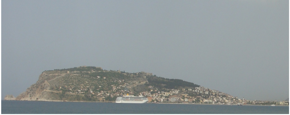
Foto 1. Tombolo özelliği gösteren Alanya Yarımadası'nın Oba Çayı Mevkii'nden görünüşü.

Alanya kalesinin ulaşımında, rölyefin ve eğimin etkisiyle çeşitli zorluklarla karşılaşıldı. Zira Alanya limanından hisara giden yol taşlı olup tekerlekli ulaşım için yapılmamıştı. Daha çok geniş ve sığ basamakları atların ve katırların gidip gelmesi içindi. Katır ya da at üzerinde hiç durmaksızın limandan saraya çıkmak en iyi zamanda bir saati alıyor olmalıydı (Redford, 2008: 66).