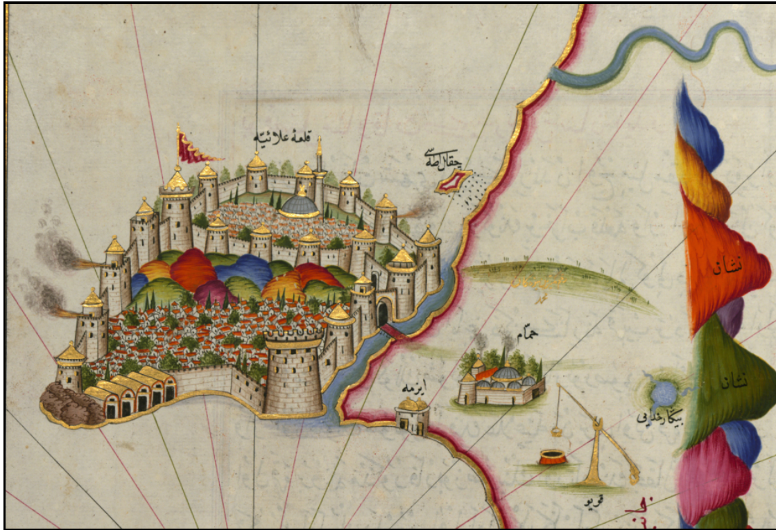
Harita 1. Piri Reis'in Alanya haritasında şehrin genel görünümü (1521).

Alâeddin Keykubâd döneminde şehrin nüfus yapısı ve miktarında da önemli gelişmeler meydana gelmiştir. Fetihden sonra, varılan anlaşma gereği kalenin eski idarecileriyle birlikte bir grup nüfus ayrılmış, buna karşılık çok sayıda idari ve askeri görevliler ile göçer Türkmen aşiretleri şehre veya çevresine yerleştirilmiştir. Şehir ve çevresi, geniş kapsamlı imar faaliyetleri, ekonomik fonksiyonlarda çeşitlenme ve ticaretin canlanması sonucu, ülke ve bölge içinde nüfus bakımından bir çekim merkezine dönüşmüştür.