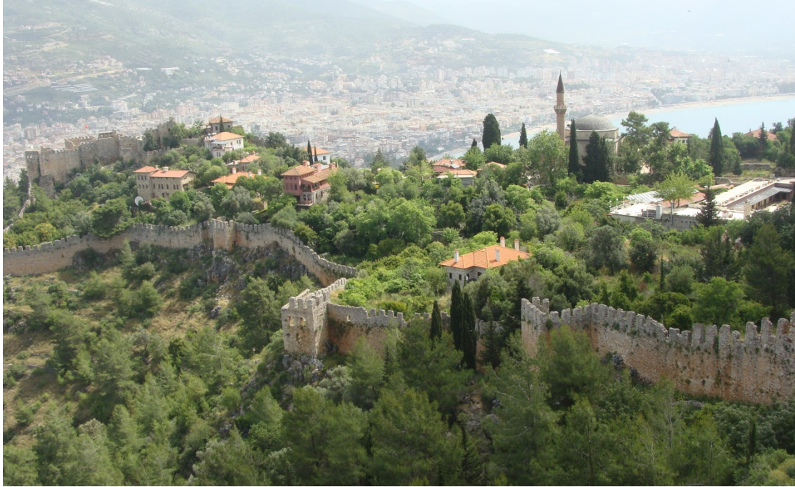
Foto 2. Sultan Alâeddin Keykubâd Alanya Kalesi'nin inşasına ve şehrin imarına büyük önem vermiştir.