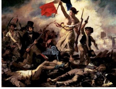
Görsel 1. Eugene Delacroix, Halka Yol Gösteren Özgürlük, 260 cm x 325 cm, Tuval Üzerine Yağlı Boya, 1830