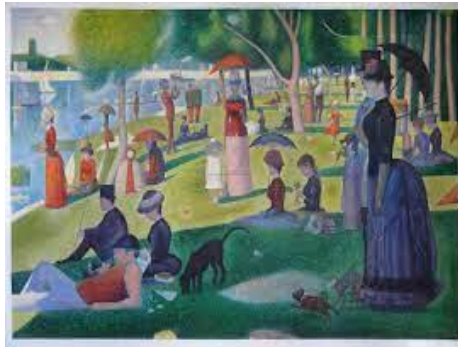
Görsel 5. Seurat, Grande Jatte Adası’nda Bir Pazar Günü Öğleden Sonra,1884-1886

Seurat optik ve renk teorilerini çok iyi incelemiştir. İzlenimci olarak başlayıp Yeni araştırmalarıyla “Yeni İzlenimciler” akımına öncülük eden sanatçı, Renkli noktalarla resimden yansıyan ışık etkisini Fransız Kimyacı Michael-Eugene Chevreul ile birlikte inceleyerek geliştirdi (Görsel 5). Burada dikkat çekilen Bilimsel araştırmalarıyla sanatçıların eserlerine dönüşüm ve