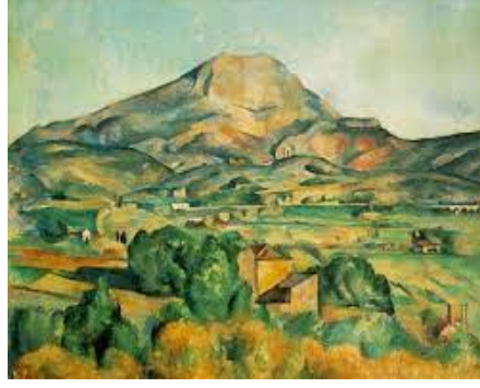
Görsel 4. Paul Cezanne, Saint Victor Dağı ,1895,73x92 cm.