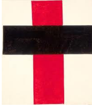
Görsel 9. Kazimir Maleviç, Beyaz Üzerine Büyük Haç, 88x70 cm. Stedelijk Müzesi, 1921

çok kısadır. Evrensel olan, renklerin yarattığı tinsel yankıdır; yani renklerle ruha dokunmak ve ruha ulaşmaktır. Farago (2006, s.187), önceden resmin biçimsel ögesi olarak kullanılan renk obje/nesne özelliği olarak resmedilirken bilimsel araştırmaların çoğalması beraberinde duyum/algı boyutuna taşınmıştır. Batı sanatında tarihsel sürece bakıldığında resimde renkler, boya maddesi, zihinsel algılama boyutuyla Çağdaş Sanat anlayışıyla birlikte anımlanmıştır. Bu da rengin duysal niteliğini konu alan sanatçılar açısından çok önemli olmuştur. Bilimin temelinde resim sanatında fizyolojik, psikolojik, sosyal ve görsel algı kapsamında ele alınan renk olgusu Empresyonistler(izlenimciler), Ekspresyonistler(dışavurumcular),Optik-Art sanatçıları ve Fovistler açısından farklı düşünsel açılardan ele alınmıştır. Duyuların/Kavramların görsel sanatlarda ağırlıklı ele alındığı 1950 sonrasında neyin resmedildiğinden çok neyin anlatılmak istendiğine izleyiciyi yöneltmiştir. Süprematist Kazimir Maleviç'e bakıldığında felsefe alanı ile ilgilenen sanatçıya göre; içerik ve konudan, görünenden vazgeçmek bir ressamın ulaşması gereken bir konumdu. Nesnel dünyası insanın maddeci dünyasında yine insanın oluşturduğu şeylerse muhakkak bundan vazgeçilebilirdi. Böylece geçmiş tabular yıkılıp yeniden inşa edilebilirdi.