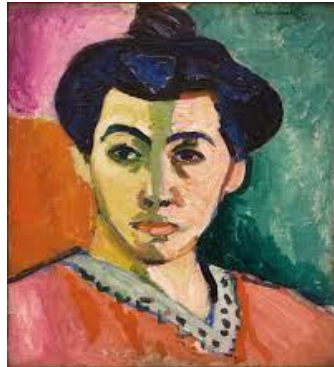
Görsel 6. Henri Matisse, Bayan Matisse (Yeşil Çizgi) ,1905, Tuval Üzerine Yağlıboya, 40x32 cm.

Bu tepkilerden ilki Henri Matisse, Andre Derain, Maurice de Vlaminck isimli sanatçılardan gelmiştir. Ekspresyonizm 'in puslu havasına alışmış gözler için Fovizm'in canlı, keskin ışık etkileri, fırçalarının keskinliği Fovistlerin (yırtıcı, vahşi) olarak isim almalarını sağladı. İçlerinde en belirleyici, dikkat çekici Henri Matisse denilebilir. Zamanla sert fırça etkilerini yumuşatarak daha yumuşak dekoratif etkileriyle yapıtlarını resmetmiştir. Henri Matisse, "Yeşil Çizgi" (Görsel 6) isimli yapıtında aslında Bayan Matisse'i bir portre gibi yansıtmak yerine kendi duygularını ve gördüğünü, dışavurumunu yansıtmıştır.