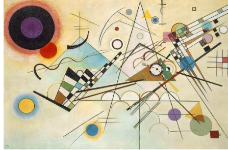
Görsel 9. W. Kandinsky, Kompozisyon 8, 1923, 140x201 cm.

Tuval Üzerine Yağlı Boya, Guggenheim Müzesi, New York.