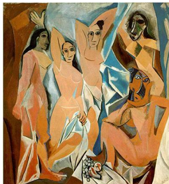
Görsel 7. Pablo Picasso, Avignonlu Kızlar,1907,Tuval üzerine yağlıboya, 243.9x233,7 cm. Museum of Modern Art, New York, ABD

20.yüzyılın en önemli sanatçılarından biri olan Pablo Ruiz Picasso için de Cezanne gibi ortaya koyduğu nesnenin ne olduğu ile değil, yaratıcı ilkesiyle birlikte ne olduğu önemlidir burada