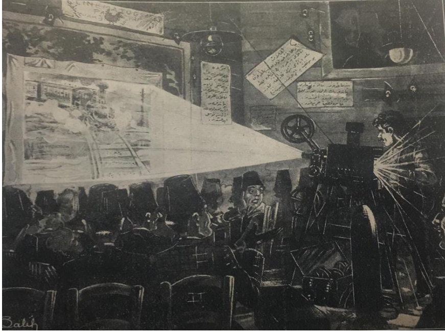
Kaynak: Resim Salih Erimez (Talu, 1943)

Ercüment Ekrem Talu'nun anıları, "yazarın ilk seyir deneyimine ilişkin kişisel bir tarih vesikası olmanın ötesinde, sinemayla yeni tanışan bir kitlenin ilk tepkilerinin, dönemin gösterim pratiklerinin, sinemanın gündelik hayatta hangi tartışmalarla konu olduğunun kaydını tutan ve bu yanıyla da irdelenmesi gereken temel değerde bir belgedir" (Öktem, 2014). Sponeck Birahenesi'nde gösterilen ilk filmler kısa aktüel görüntülerden oluşuyordu ve "lambalardan çıkan ağır gaz kokuları meraklı izleyicileri rahatsız ettiği halde, bu 'ilk gösteri', bir 'sihirli icat' olarak büyük bir ilgiyle karşılanmıştı" (Özgüç, 1990, s. 8). Fakat bu filmlerin gösterildiği dönemin Pera'sı daha çok gayrimüslimlerin yaşadığı bir yerdir. Yazar Refik Halit Karay'a (2011, s. 84) göre o dönemde "İstanbul tarafında oturanların çoğu için Beyoğlu'na geçmek sadece uzun ve zahmetli değildi; oldukça ayıp, suça benzeyen de bir işti." Dolayısıyla Pera, Müslüman halkın gitmeyi çok tercih ettiği bir yer değildir. M. Henri Delavallée de ilk sinematograf gösterisinden iki ay sonra Müslüman halkın daha çok yaşadığı Şehzadebaşı'ndaki Fevziye Kıraathanesi'nde 8 film gösterileri düzenlemeye başlamıştır.