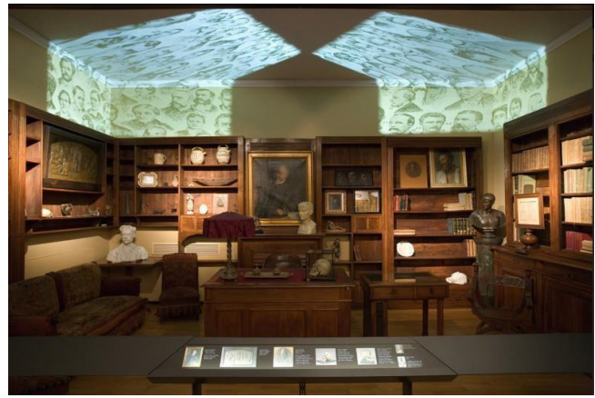
Figür 4: Cesare Lombroso'nun Müzede Sergilenen Çalışma Odası