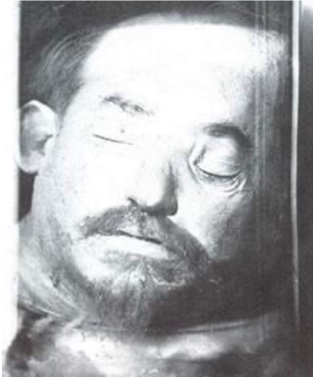
Figür 3: Cesare Lombroso'nun Kavanozda Korunan Yüzü