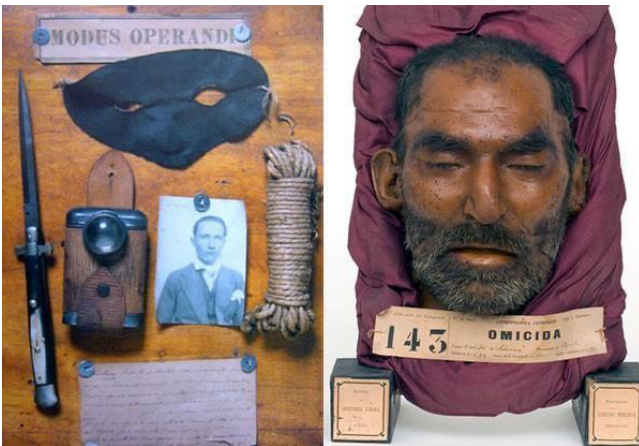
Figur 2: Solda; Cinayet Silahlarına İlişkin Nesnelere, Sağda; Suçlunun Ölüm Maskesi https://cabinetofcuriosities.ca/lombrosos-museum-of-criminal-anthropology/ Erişim Tarihi: 20.06.2021