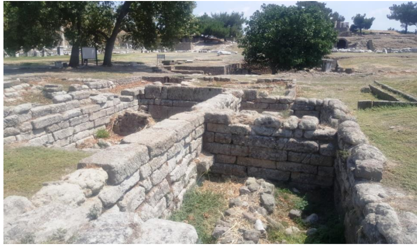
Resim 13. Uyku Odaları