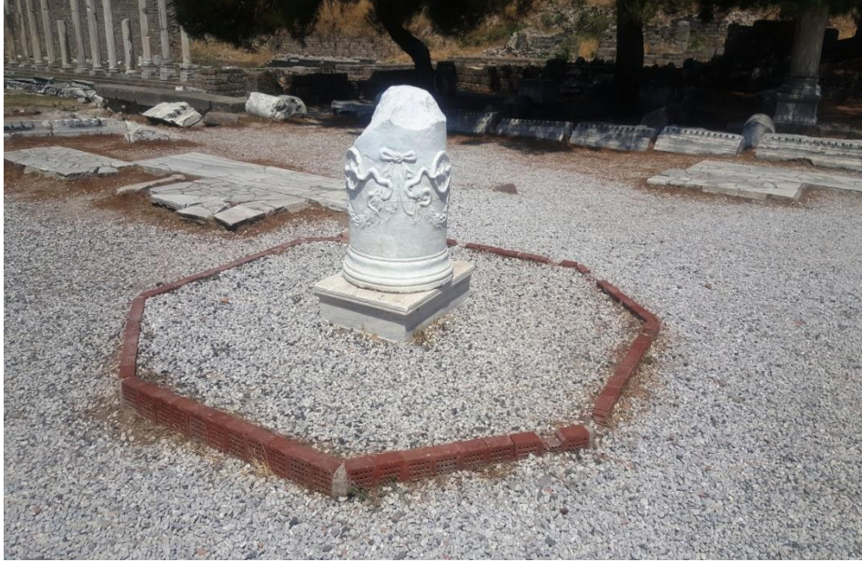
Resim 15. Yılanlı Sütun