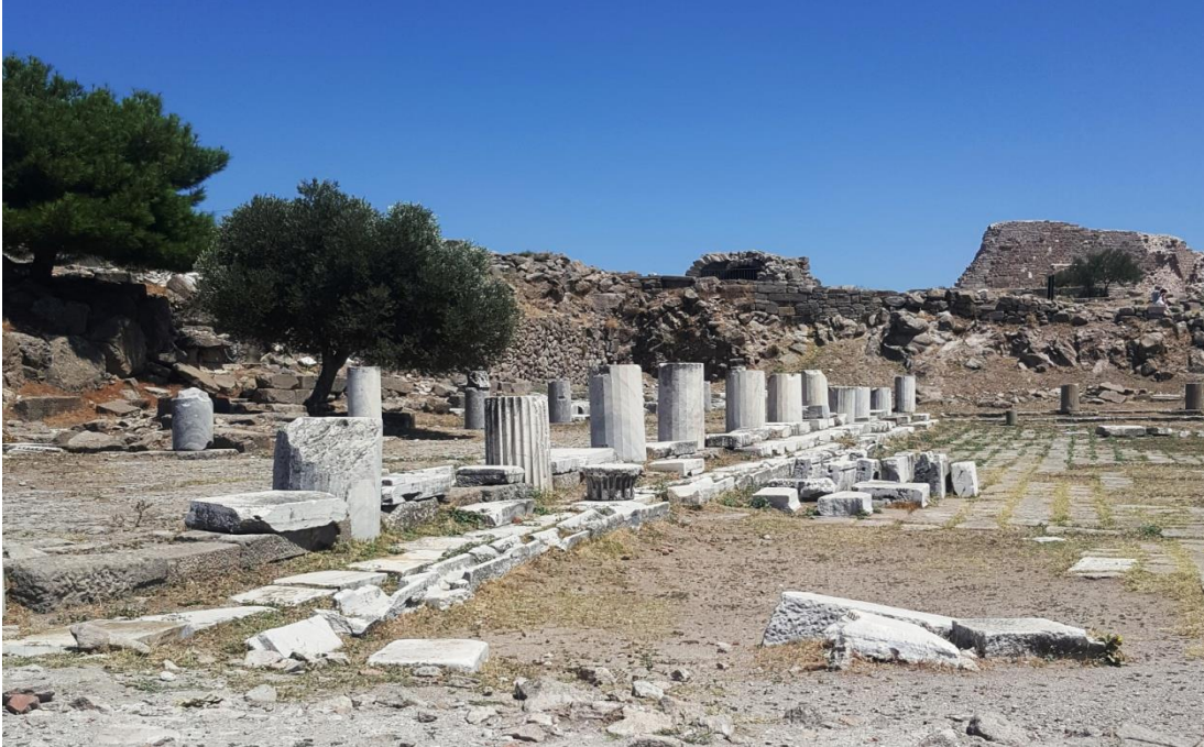
Resim 2. Bergama Kütüphanesi Kalıntıları