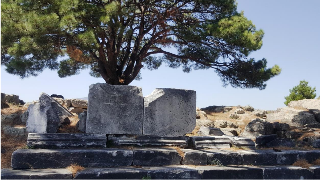
Resim 3. Zeus Sunağı Kalıntıları