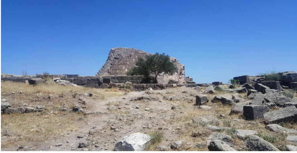
Resim 8. Kral Sarayları Kalıntıları