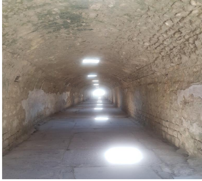
Resim 14. Tünel