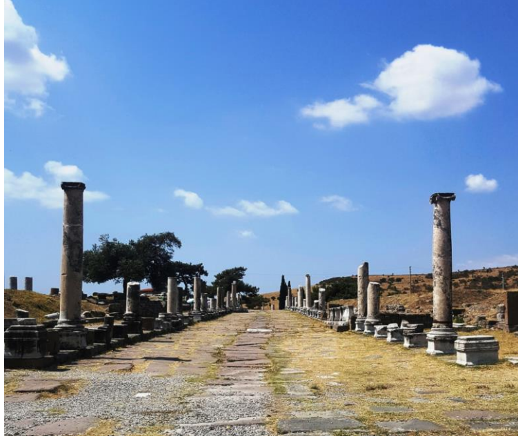
Resim 11. Asklepion Kutsal Yol