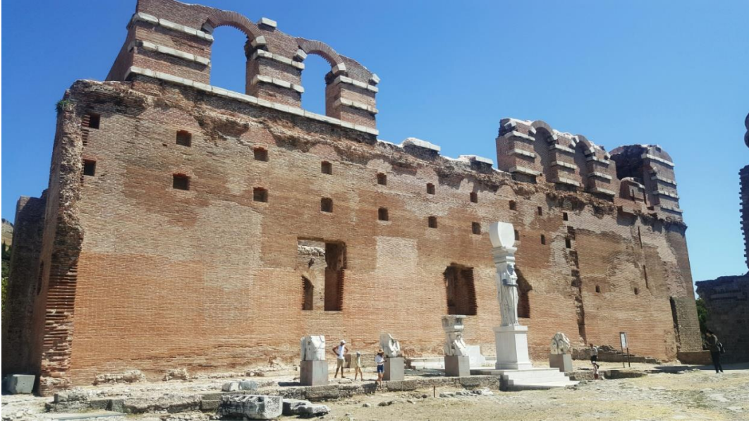
Resim 18. Kızılavlu