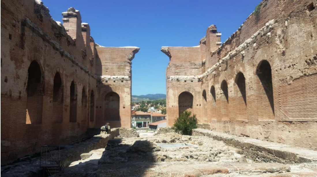
Resim 17. Kızılavlu