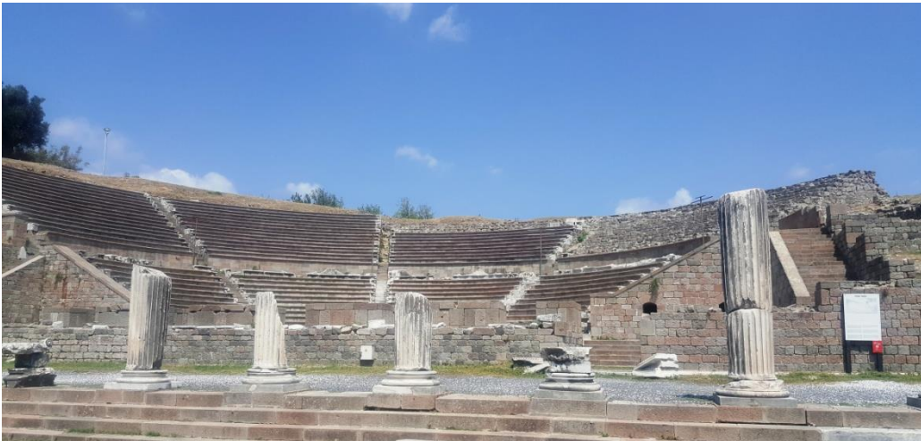
Resim 10. 3500 Kişilik Tiyatro