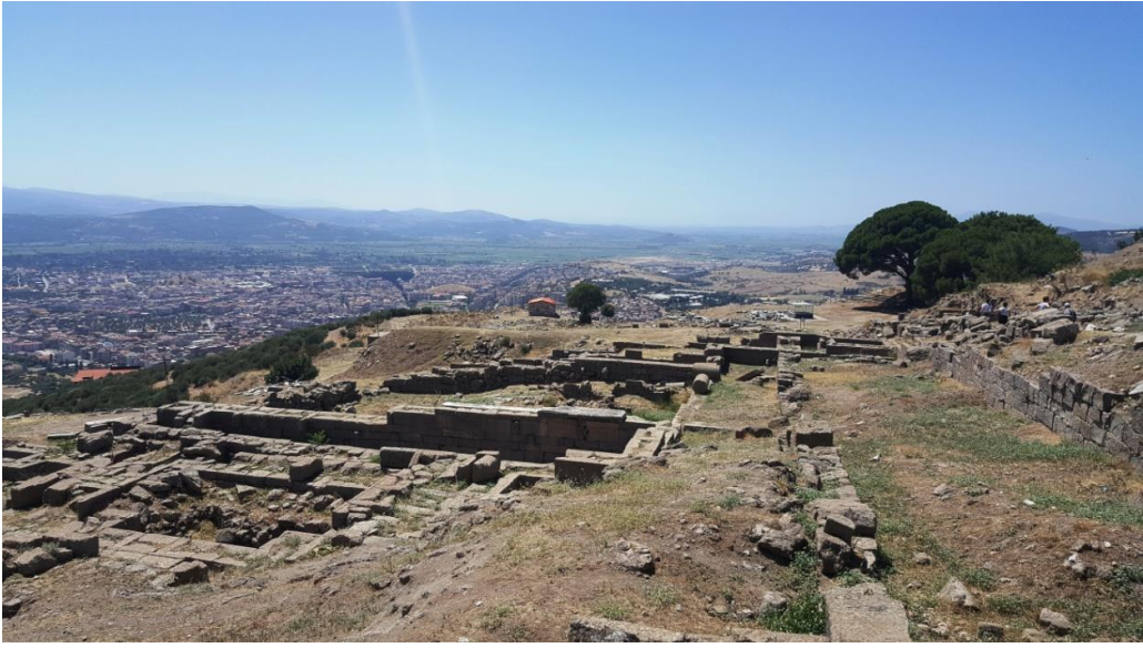
Resim 9. Heroon Kültü