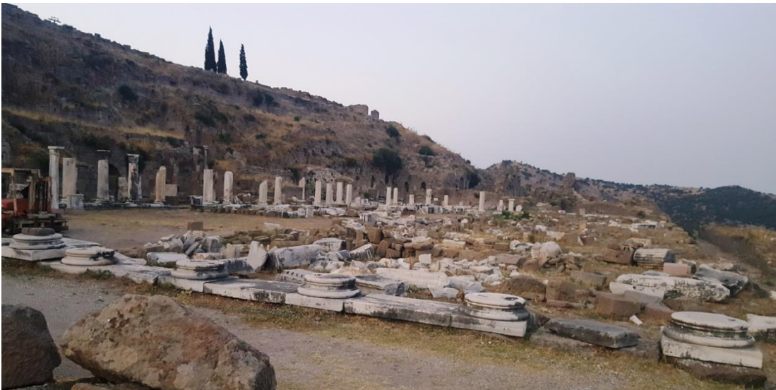
Resim 7. Yukarı Gymnasyum Kalıntıları