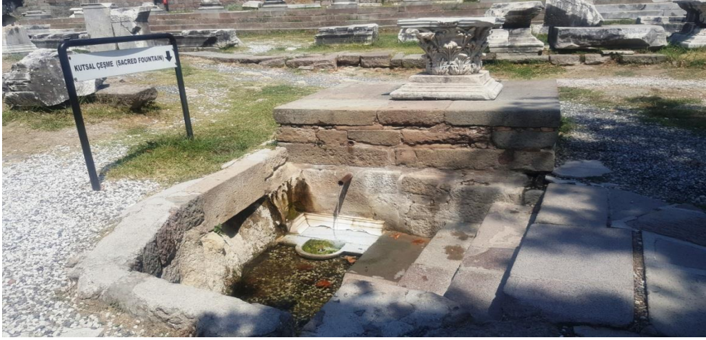
Resim 12. Kutsal Çeşme