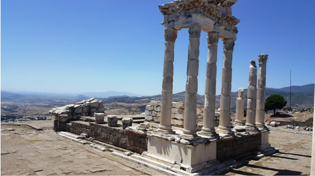
Resim 4. Trajan Tapınağı Kalıntıları