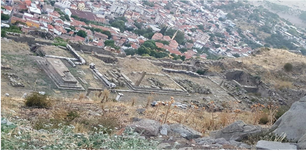
Resim 6. Demeter Tapınağı Kalıntıları