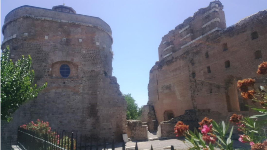
Resim 16. Kızılavlu