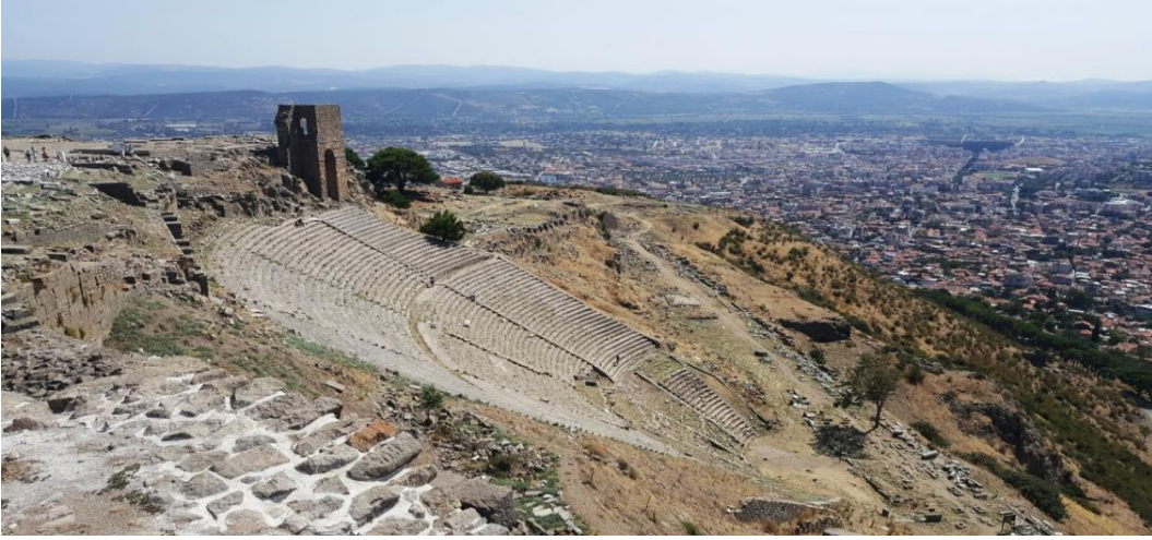
Resim 1. Bergama Tiyatrosu