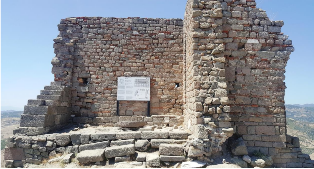
Resim 5. Athena Kutsal Mahalli