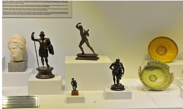
Resim 20. Bergama Müzesi