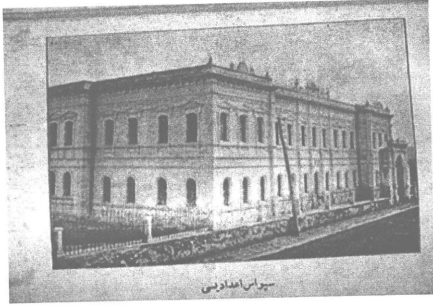
Kongre Günlerinde Sivas Sultânisi