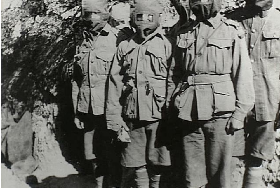
Şekil 2. Members of the 14th Battalion wearing their gas masks in Monash Valley. These masks were an early design and men in this area did not need to use them often as the Turks did not use gas or smoke during the campaign.

İngilizler tarafından çekilen yukarıdaki gaz maskeli askerlerin resminin altındaki İngilizce yazıda “aslında Türkler gaz kullanmadığından gaz maskesine gerek yoktu.” yazmaktadır. Gerçekten Türk tarafında böyle bir imkan yoktu. İngilizler muhtemelen kendi kullandıkları Zehirli-Boğucu gazdan bölgedeki rüzgar nedeniyle kendi personellerinin etkilenmemesi için gaz maskesi kullanmışlardır. Yukarıda yer alan belgelerden de anlaşıldığı gibi zayıatın fazla olmasında uluslararası hukuka aykırı olarak kullanılan Zehirli- Boğucu gaz kullanımının da etkili olduğunu değerlendiriyorum.