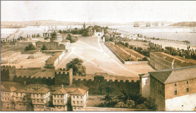
Şekil 2. Fossati'nin Albümünden 1840'lı yıllarda Soğukçeşme ve Etrafı