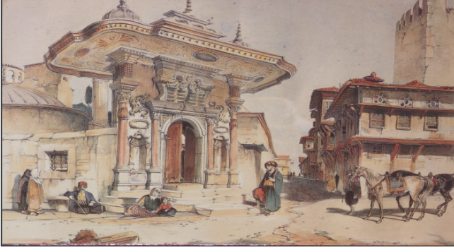
Şekil 1. Lewis'in Albümünden 1830'lu yıllarda Soğukçeşme Sokağı