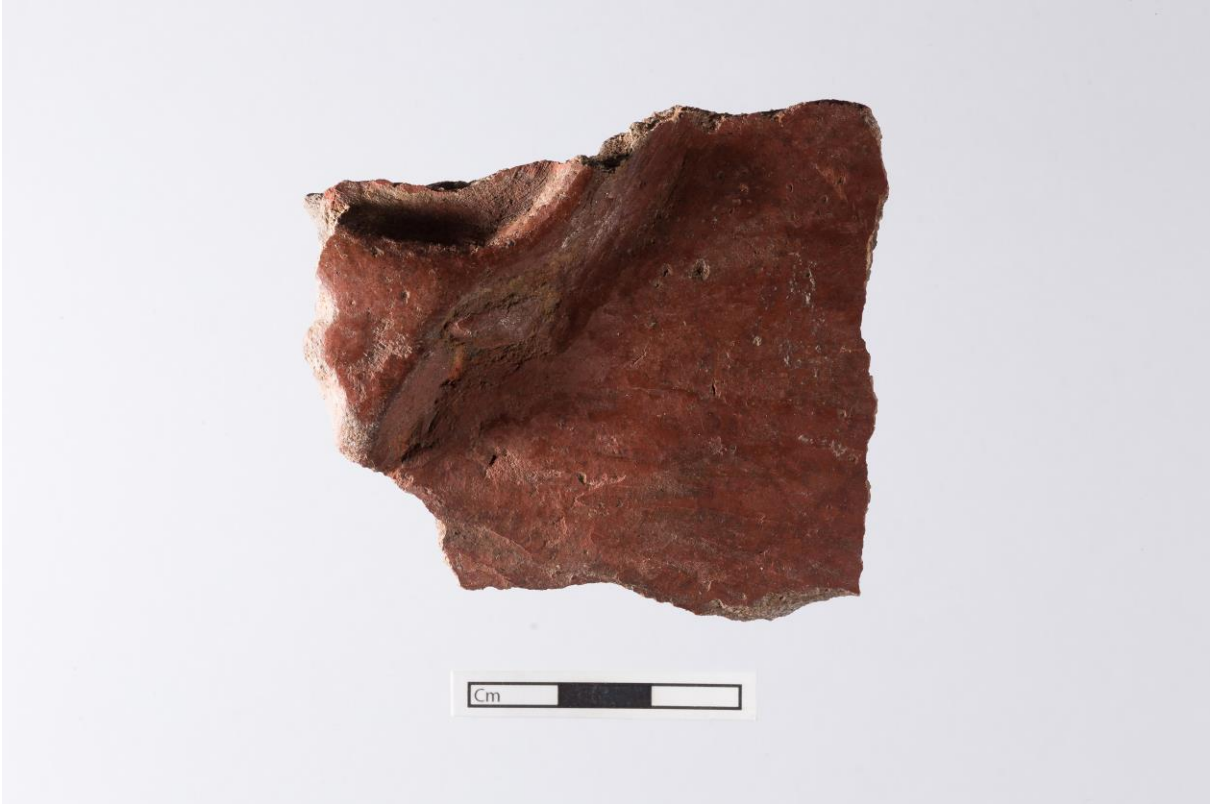
Fig. 6: Boğa başı kabartmalı gövde parçası (U.40062).