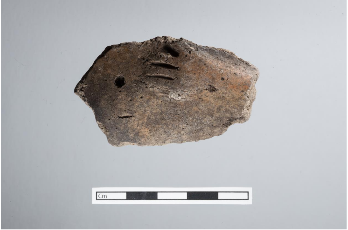
Fig. 7: El biçimli kabartmalı gövde parçası (U.40075).