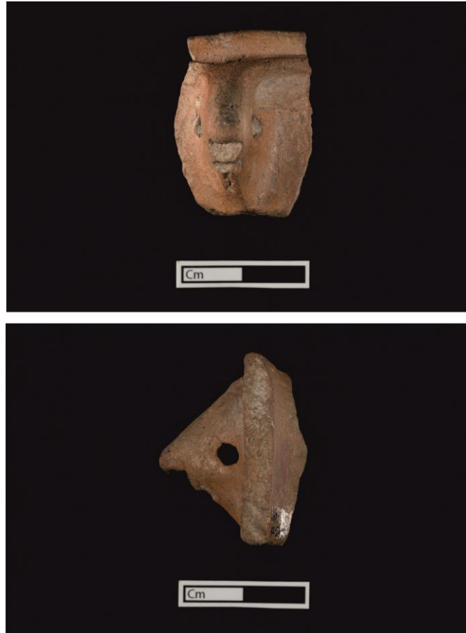
Fig. 4: Hayvan biçimli tutamak (U.40075).