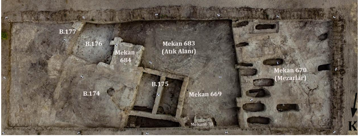
Fig. 1: Doğu Alanı Neolitik Dönem binaları (B.175, B.176, B.177) ve mekanlar (Sp. 669, Sp.670, Sp.678, Sp.683, Sp.684).