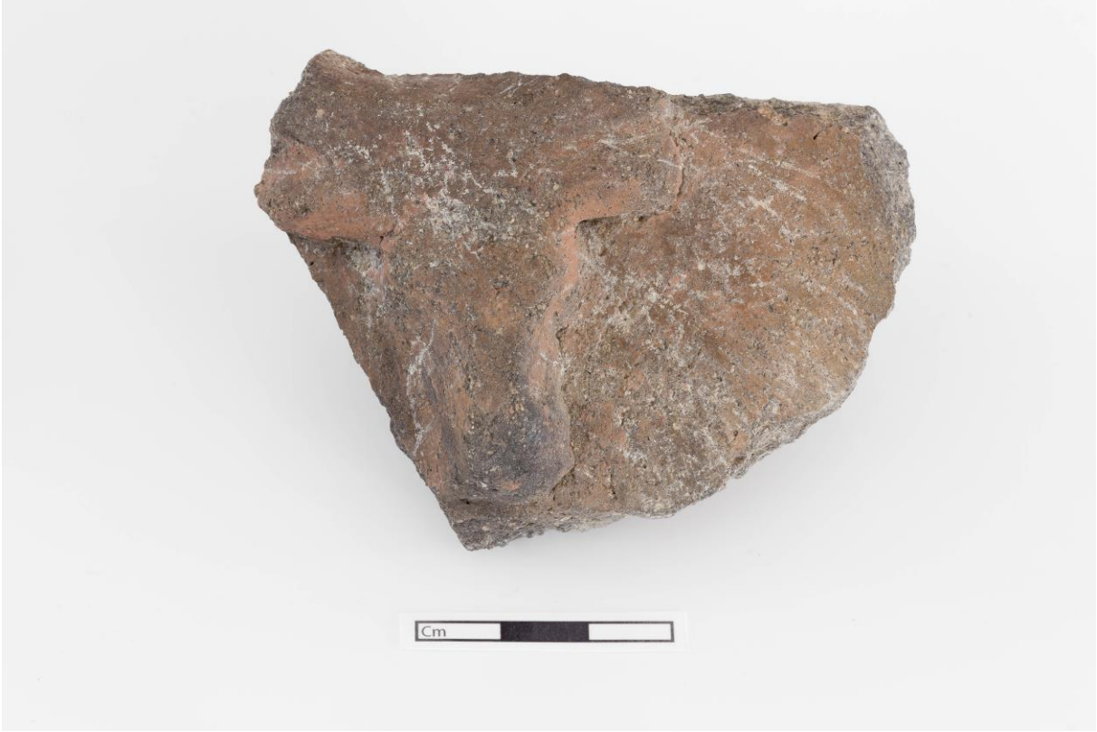
Fig. 5: Boğa başı kabartmalı gövde parçası (U.40011).