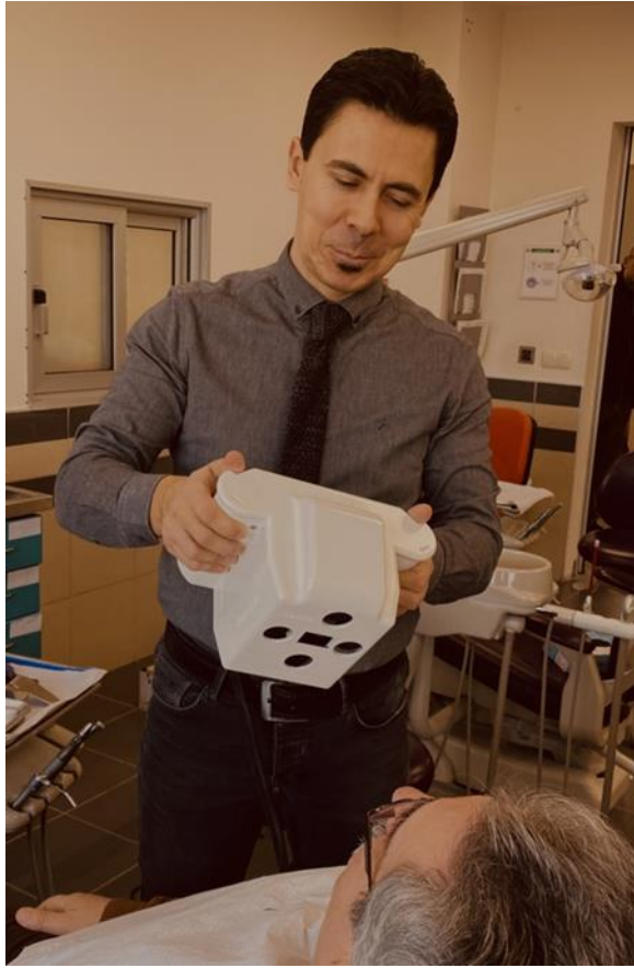
Resim 2. Icam4D® cihazı ile hastadan ölçü alınması.