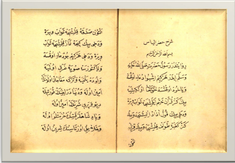
Resim 3- Mecmuanın ilk sayfaları.