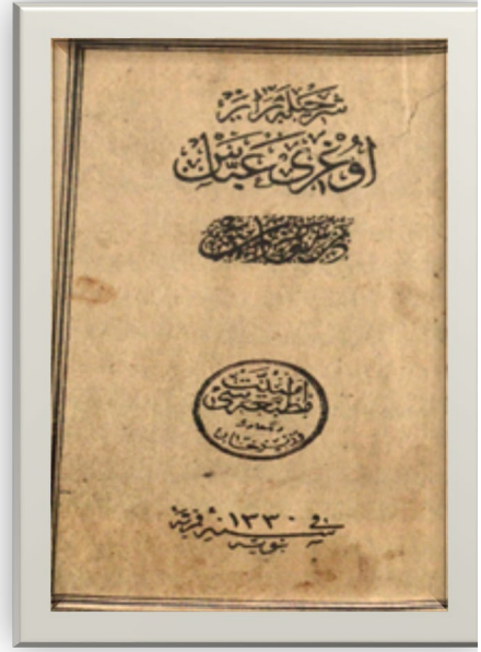
Resim 2- Uğrı Abbas Duasının Emniyyet Matbaası baskısı.