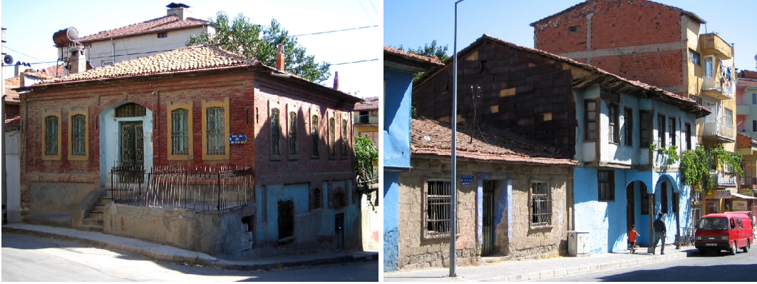
Şekil 9, 10. Uşak kentsel sit alanı farklı kat yükseklikleri ve yapım tekniğine ait yapılar

taş süslemelerle karşılaşılmaktadır. Ahşap süsleme ise daha çok kapı ve saçak altlarında karşımıza çıkmaktadır (Şekil 9 10).