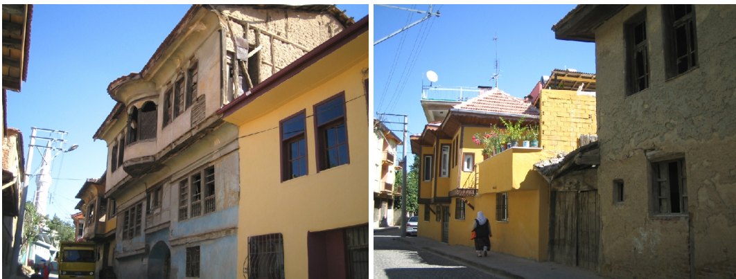
Şekil 5, 6. Uşak kentsel sit alanı yapı çıkma örnekleri ve sokak dokusu

Kentsel sit alanı içindeki sivil mimarlık örneklerinin kitleleri parsel sınırının sokak cephesine dayanmıştır. Binaya ait bahçe ya binanın tamamen arkasında ya da arka ile birlikte kitlenin yanında yer almaktadır. Tarihi Uşak konutları genelde bitişik nizamda inşa edilmiştir ve birbiriyle uyum sergiler (Şekil 5, 6).