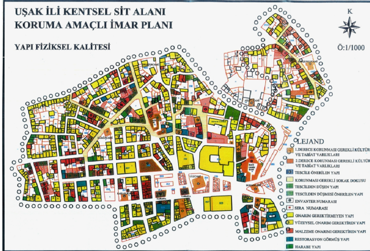
Şekil 4. Uşak kentsel sit alanı yapı fiziksel kalitesi (Gürel ve ark., 2007)

üstlenmişlerdir. Kent dokusunun yoğun olarak yer aldığı alanın kuzeyinde ise avlulu ve bahçeli yapılar gözlenmektedir (Şekil 4).