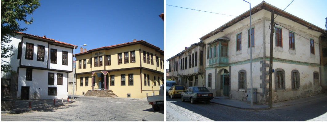
Şekil 7, 8. Uşak kentsel sit alanı restore edilip yeni işlev verilen yapılar ile onarım gerektiren yapılar

edilen çıkmaların yapılara özgünlük kazandıran en önemli öge olduğu görülür. Ahşap kirişleme sistemiyle oluşturulan kapalı çıkmalarda (cumba), çıkmayı çerçeveleyen ahşap profiller bulunmaktadır. Çıkma altında ise daha çok demir, ahşap ve taş malzemelerden yapılmış olan taşıyıcı konsol elemanlara veya payandalara rastlanmaktadır (Şekil 7, 8). Cephede pencere ve kapılar genellikle taş söveli olup, bazı örneklerde açıklıkların üstünde sade veya süslü kemerler ve lentolar bulunmaktadır. Cephe düzenlemelerinde dikkati çeken bir diğer unsur ise kalemişi, ahşap, alçı ve taş süslemelerdir (Gürel ve ark., 2007).