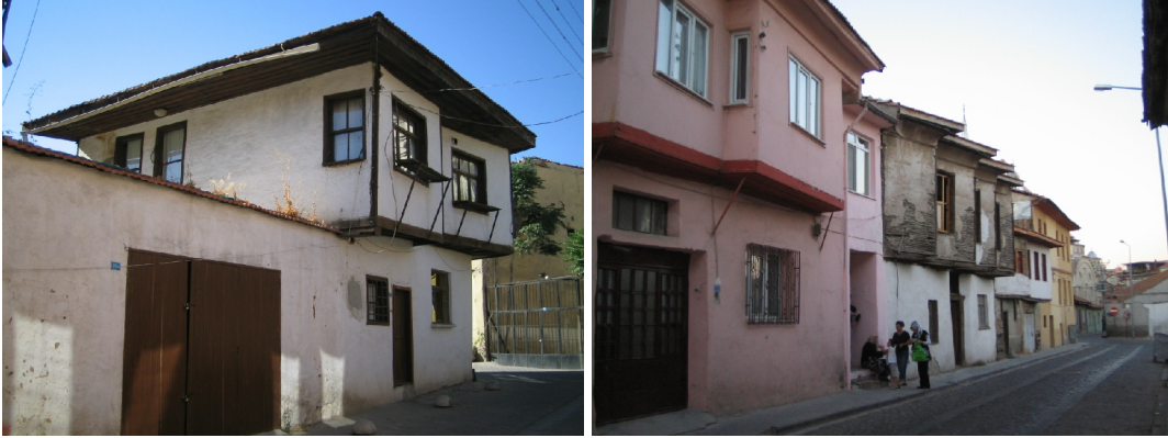
Şekil 1, 2. Uşak kentsel sit alanı konut yapısı ve komşuluk ilişkisi

Uşak'ta yapılan konutların yerleşim şeklinin belirlenmesinde iklim ve doğal şartların etkisi yanında geleneklerin de rolü büyüktür. Konutların büyük bir çoğunluğu geleneksel Türk kent mimarisinin belirgin özelliklerini yansıtmaktadır (Şekil 1, 2).