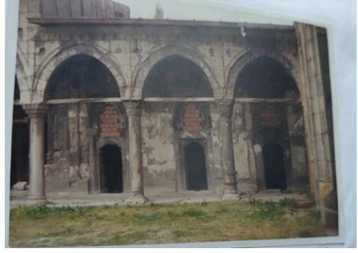
Şekil 1. Sivas Gök Medresede Öğrenci Odalarının Önündeki Revaklar

Öğrencilerin yatakhane olarak kullandığı yerler genellikle medrese avlularının sağında ve solunda bulunan odalardır. 17 Sivas Gök Medresede avlunun her iki tarafında da öğrenci odaları bulunmaktadır. Aynı şekilde, Konya Karatay Medresesinde avlunun sağ ve solunda üçer adet toplam altı adet öğrenci odası mevcuttur. 18 Medreselerin bir kısmında öğrenci odaları, avlunun her iki tarafına yerleştirilirken bazılarında ise sadece bir tarafına yerleştirilmiştir. 19 Sivas’ta bulunan İzzeddin Keykavus Darüşşifasında öğrenci odaları girişin sol tarafında bulunmaktadır. 20 Sağ taraf ise tamamen sultanın türbesine tahsis edilmiştir. Aynı şekilde Kayseri Sahibiye Medresesinde de avlunun sadece bir tarafında öğrenci odaları bulunmaktadır. 21 Açık avlulu medreselerde öğrenci odalarının üstü revaklarla örtülmüştür. 22 Böylece öğrencilerin vakitlerinin önemli bir bölümünü geçirdiği bu mekânlar yağmur ve güneşten korunmuş olmaktadır.