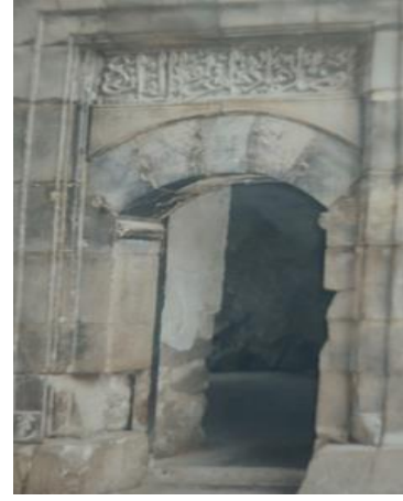
Şekil 3. Sivas Gök Medresede Öğrenci Odalarındaki Yazılardan Biri (Ümmetimin En Faziletli İbadeti Kur’an Okumaktır)