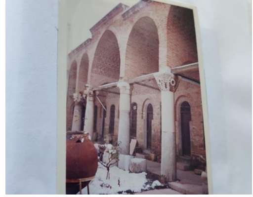
Şekil 2. Akşehir Taş Medresede Öğrenci Odalarının Önündeki Revaklar

Öğrencilerin ikametlerine ayrılan bu odalar çok geniş olmayıp, iki ya da üç kişinin kalabileceği büyüklüktedir. 23 Ahmet Eflâki de Mevlana ile ilgili bir olaydan bahsederken medresedeki her odada 2-3 öğrencinin bulunduğunu belirtmiştir. 24 Öğrenciler bu odaları hem yatakhane hem de derslere hazırlık yaptıkları bir nevi etüt salonu olarak kullanmışlardır. Nitekim Aptullah Kuran, Tokat Yağı Basan Medresesindeki odaların öğrenciler tarafından hem oturma, hem çalışma odası hem de yatakhane olarak kullanıldığını belirtmiştir. 25 Bir istisna olarak, Kayseri Sahibiye Medresesindeki odalar muhtemelen sadece yatakhane olarak kullanılmıştır. Bu medresedeki öğrenci odalarında hiç pencere yoktur. Dolayısıyla ışık almayan bu mekânlar yatma ve uyuma dışında, başka bir şekilde kullanılmaya uygun değildir. 26