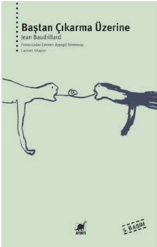
Resim 2. Jean Baudrillard'ın Baştan Çıkarma Üzerine adlı eserinin Türkçe baskısının kapağı

eserine yer vermiştir. Baudrillard'ın söz konusu kitabı üç ana bölümden oluşur. Düşünür söylemlerini kendi sosyal bilim bakışıyla sunarken metin aralarında verdiği ilginç örneklerle baştan çıkarma kavramını daha somut bir şekilde ortaya koymuştur. Baştan çıkarma kavramının kökenine bakıldığında kutsal metinler ile karşılaşılacaktır. Semavi dinlerin insana dair başlangıç anlatısı baştan çıkarma ile başlar. Adem'in cennetten kovulmasıyla başlayan süreç metaforik olarak yiyecek (elma) ile anlatılsa da Havva'nın varlığı meseleyi farklı bir boyuta taşımaktadır. Bu nedenle ilk din bilimciler arasında bunun altında bir cinsel suçun olabileceğini düşünenler olmuştur.