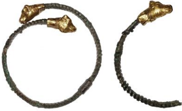
Res. 50, Kat. No 50