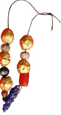
Res. 40, Kat. No 40