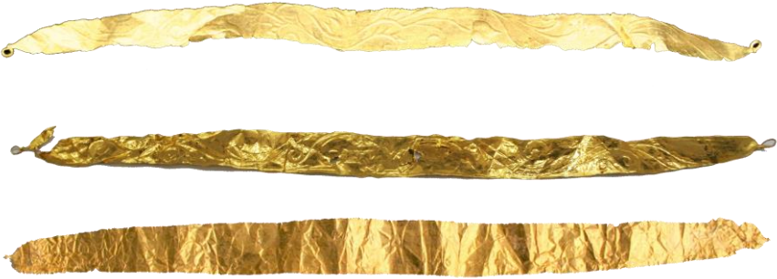
Res. 42, Kat. No 42