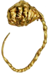
Res. 38, Kat. No 38