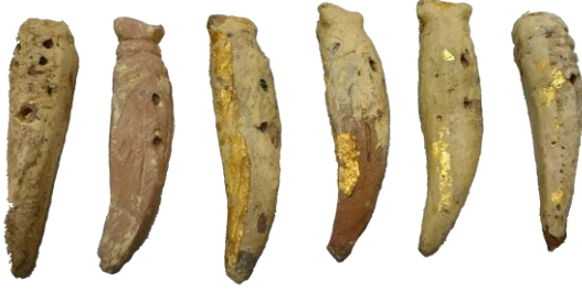
Res. 26, Kat. No 26