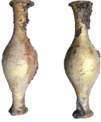
Res. 49, Kat. No 49