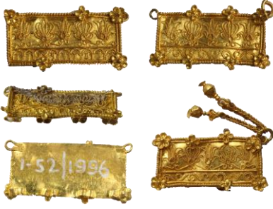
Res. 16, Kat. No 16