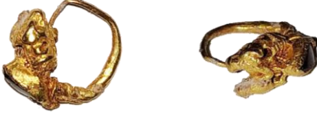
Res. 48, Kat. No 48