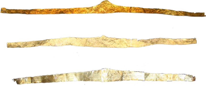
Res. 43, Kat. No 43