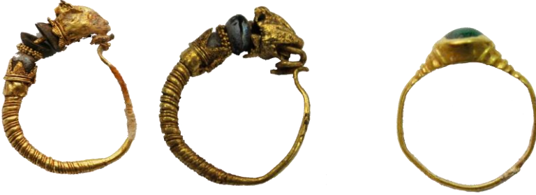
Resim 27, Kat. No 27