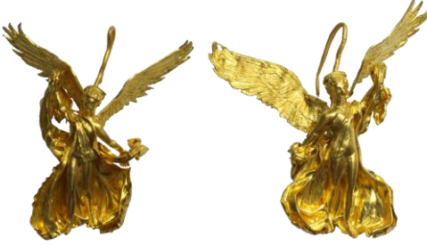
Res. 4, Kat. No 4