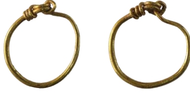
Res. 32, Kat. No 32