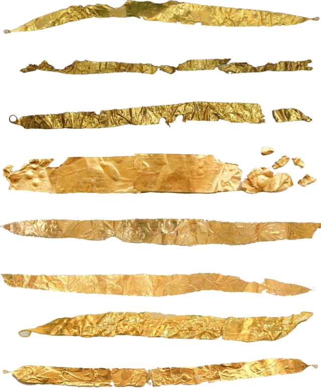
Res. 36, Kat. No 36