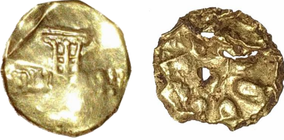
Res. 54, Kat. No 54