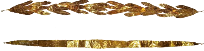
Res. 51, Kat. No 51