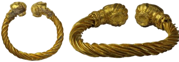
Res. 1, Kat. No 1