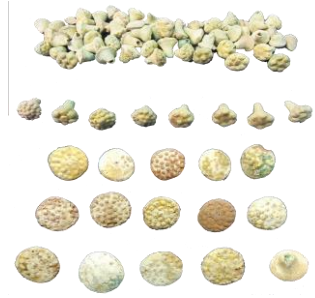
Res. 24, Kat. No 24