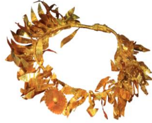
Res. 14, Kat. No 14