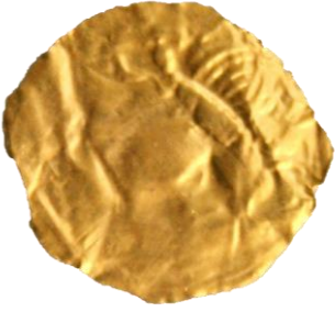
Res. 37, Kat. No 37