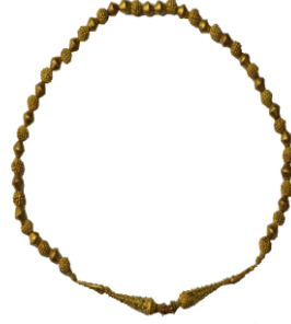
Res. 20, Kat. No 20