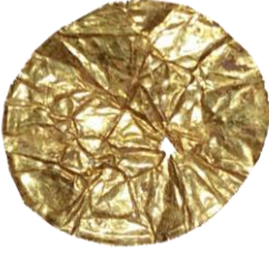
Res. 56, Kat. No 56