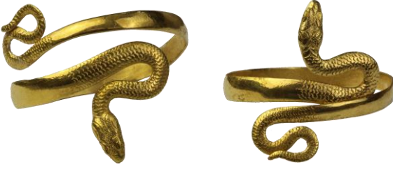
Res. 3, Kat. No 3