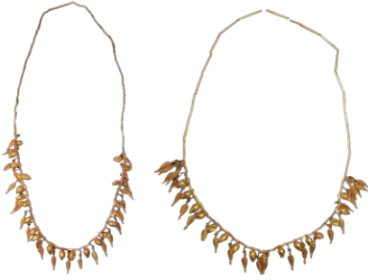
21, Kat. No 21