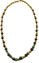
Res. 31, Kat. No 31