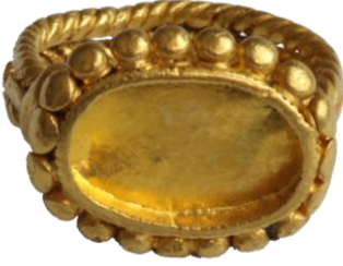
Res. 7, Kat. No 7