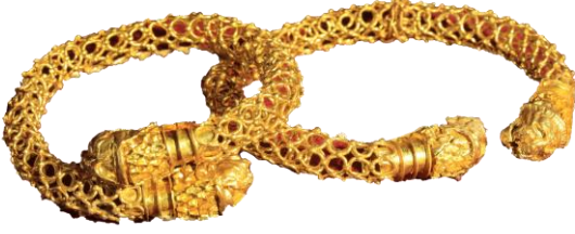
Res. 2, Kat. No 2