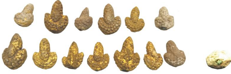
Res. 25, Kat. No 25