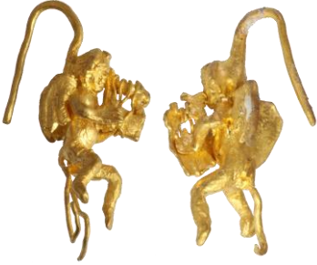
Res. 5, Kat. No 5