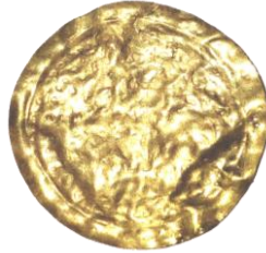
Res. 60, Kat. No 60