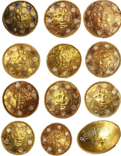
Res. 12, Kat. No 12