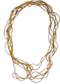
Res. 19, Kat. No 19