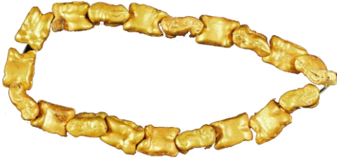
Res. 9, Kat. No 9