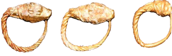
Res. 47, Kat. No 47