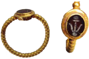
Res. 35, Kat. No 35