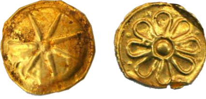
Res. 44, Kat. No 44