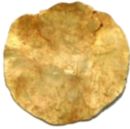
Res. 46, Kat. No 46