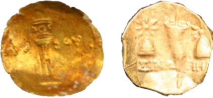
Res. 45, Kat. No 45