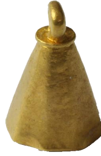
Res. 22, Kat. No 22