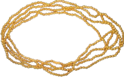
Res. 18, Kat. No 18