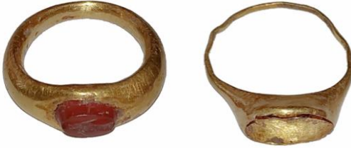
Res. 53, Kat. No 53