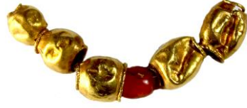
Res. 58, Kat. No 58