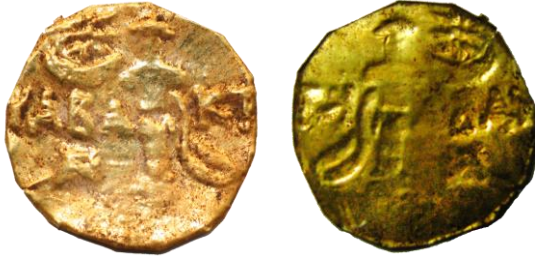
Res. 29, Kat. No 29