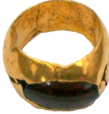
Res. 39, Kat. No 39