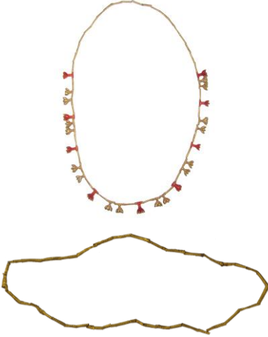
Res. 17, Kat. No 17