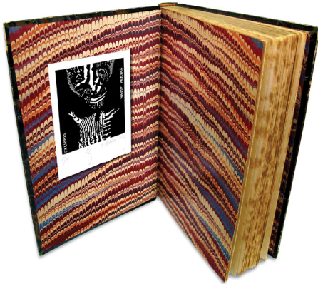
Resim 4: Kitabın iç kapağında bir ekslibris

Türkiye ekslibrisi Avrupa'da gelen ekslibrislerin yer aldığı kitaplar sayesinde tanınmıştır. Kitapların sahipleri öldüğünde yakınları tarafından kütüphanelere bağışlanmıştır. 2000'li yıllardan bu yana güzel sanatlar eğitimi veren kurumlardaki hocaların özendirmeleriyle, özellikle gençlerin ekslibrise ilgisi artmıştır.