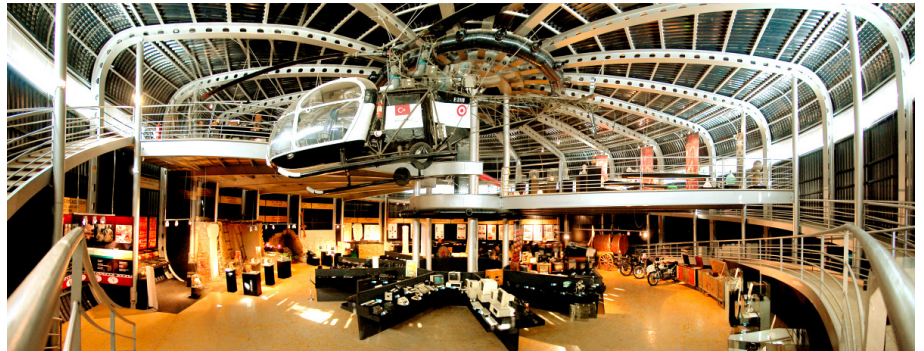
Resim 2: Orta Doğu Teknik Üniversitesi Bilim ve Teknoloji Müzesi https://tbm.metu.edu.tr/bilim-ve-teknoloji-tarihi-sergisi