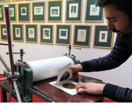
Resim 8: İstanbul Ekslibris Müzesi'nde bir workshop

yönelik ilk Ulusal Ekslibris Kongresini düzenlemiştir. Kongre kapsamında ulusal koleksiyon sergisi ve Ekslibris Araştırmaları Konferansı yapılmıştır. Müzenin sergileme ve eğitim amacı yanında araştırma çalışmalarını da yaygınlaştırması gerektiği düşünülerek “EX-LBRIST” adlı Uluslararası Online Hakemli Ekslibris Dergisi'nin yayınına başlanmıştır. (www.exlibrist.net)