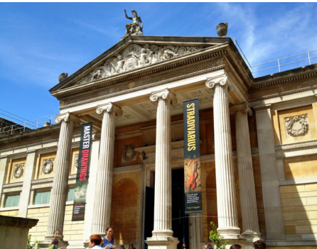
Resim 1: Oxford Ashmolean Müzesi

“Gençlerin müzeleri sık sık ziyaret etmeleri, bu gezilere çoğu zaman aileleri ve arkadaşları ile birlikte gelmeleri sayesinde; gerek bilgi gerekse kişisel zevk ve estetik bakış açısı kazandırılarak müzelere ziyaret alışkanlığı geliştirilebilir. Bu ziyaretler, okullar kapandıktan sonra da eğitim ve öğretimin durmadığı fikrinin benimsenmesi anlamına gelir ki, işte o zaman bu eğitim, ‘Yaşam Boyunca Eğitim’ demektir.” (Pekgözlü Karakuş, 2012, 134)