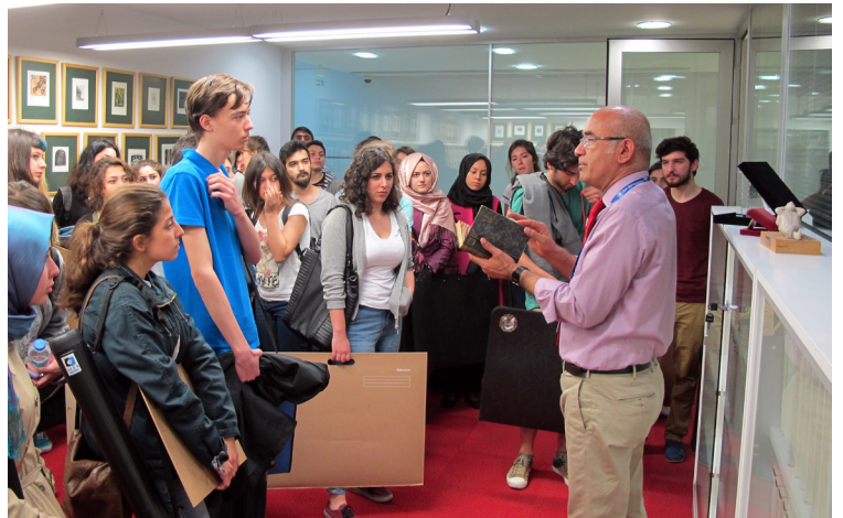
Resim 7: Ekslibris Müzesinde bir tanıtım