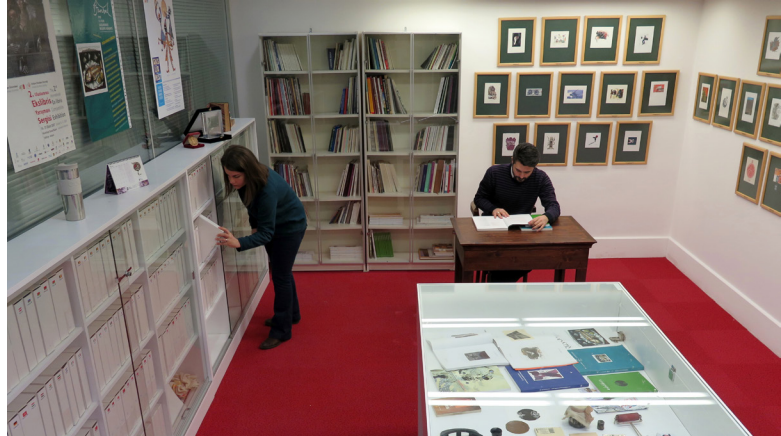
Resim 3: İstanbul Ekslibris Müzesi'nden bir görüntü

Türkiye'de 196 üniversite vardır. Fakat üniversite müzesi sayısı 38'i geçmez. Bunlardan biri, Işık Üniversitesi'nde kurulan İstanbul Ekslibris Müzesi'dir. Küçük ama işlevi ve koleksiyon değeri büyük olan bu müze, Türkiye için yeni olan Ekslibris sanatının yaygınlaşması ve tanınması misyonunu da üstlenmiştir.