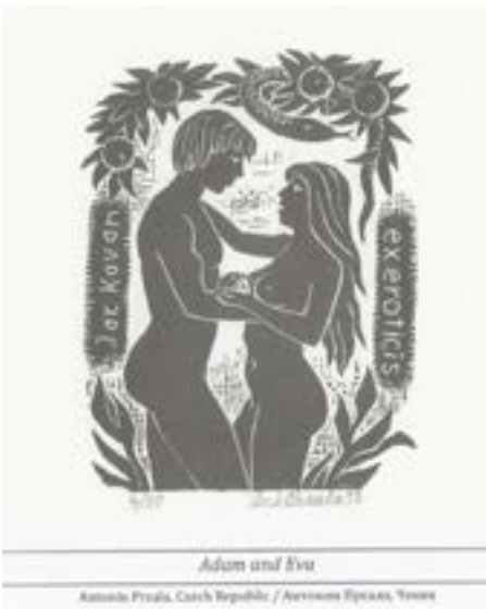
Görsel 7 Antonin Prsala, ekslibris, (Çek Cumhuriyeti)