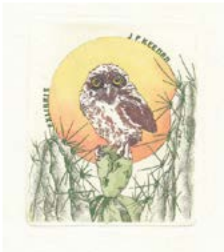
Görsel 8 Elly de Koster, ekslibris, (Hollanda)