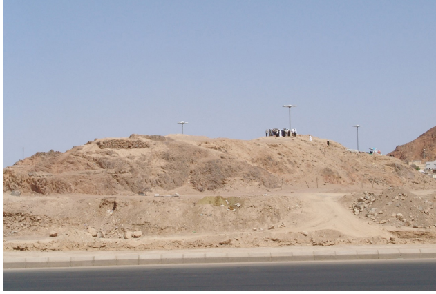
Resûlullah'ın Uhud Gazvesi'nde Abdullah b. Cübeyr komutasında 50 okçuyu konuşlandırdığı Ayneyn (Okçular) Tepesi (Mağlûs, Siyer Atlası , 2014, 245)

dedi. [28] Abdullah'ın okçular tepesinde komutan tayin edilmesi onun ok atma becerisi yanı sıra dirayeti, sebatı ve kararlığı gibi güzel özellikleri de etkili olmuştur. Burada dikkat çekilecek bir başka husus da Hz. Peygamber'in bu tepeye muhâcirlerden değil de ensardan bir kişiyi tayin etmesidir. Ensar, Bedir'le gazve ve seriyyelerde görev almaya başlamıştı. Abdullah b. Cübeyr de ensardan bir gazvede üst düzey askerî görev almış ilk kimselerden birisidir.