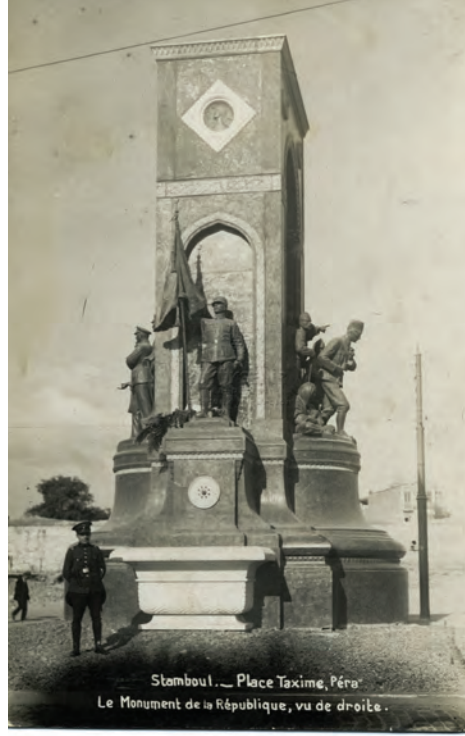
Şekil 8: İnşa edildiği dönemde Cumhuriyet Anıtı

"Sinyor Kanonika'nın İstiklal cengi ile Milli Mücadele ile ne alakası olmuştur ki ondan milli bir hassasiyetin en büyük ifadesini bekledik? Sakarya'da bu sinyorun babası mı şehit düşmüştür, oğlu mu? Sırtında cephane taşıyan Türk köylü kadını bu sinyorun nesidir, anası mı kız kardeşi mi? Mütareke'de işgal kuvvetlerinin işkenceleri altında inleyen, sanatkâr Mimar Sinan'ın torunları değildir de bu İtalyan mıdır? Her malımız yerli olacak da milli vicdanımızı Avrupa'dan mı getireceğiz? Türk sanatkârları dururken Avrupa'ya müracaat etmek, takma saç gibi göğsümüzün içinde iğreti bir kalp oturtmak demektir. Bunlar öyle kaba ve basit hakikatlerdir ki yarım liralık bir estetik kitabının sayfelerinden öğrenmek kabilken bize yüz binlerce liraya mal oldu (Safa, 1933)".