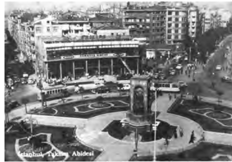
Şekil 10: Kristal Gazinosu ve Taksim Cumhuriyet Anıtı