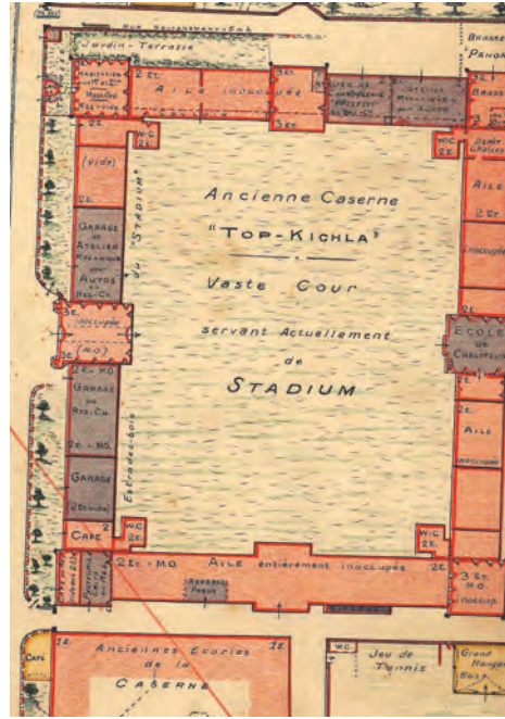
Şekil 5: Topçu Kışlası, 1925 Pervititch Haritası

Anıt ile Taksim Meydanı'nda yeni, şanlı, güçlü bir dönemin başlangıcı maddeleşmiştir. Anıtın inşası ile Taksim Meydanı'na biçilen yeni kimliğin mimarı Pietro Canonica olmuştur (Şekil 8). Anıt, yapılaşının hemen ardından tartışmalara neden olmuş, sonraki dönemlerde meydanla birlikte anıtın yıkılması, anıtın taşınması, anıtın değiştirilmesi gibi çeşitli başlıklarla gündeme gelmiştir. Peyami