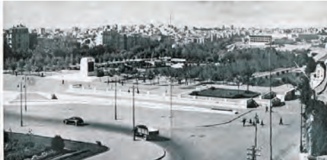
Şekil 6: Gezi Parkı ve Taksim Meydanı (İstanbul Belediyesi Neşriyat ve İstatistik Müdürlüğü, 1949)