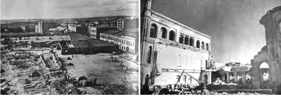
Şekil 3: Taksim Kışlası'nın ahırları yıkılıyor (sağda), Kışla yıkılıyor (solda). (Gülersoy, 1986:83,97)

Anıtı'nın yapılması, üçüncüsü ise Topçu Kışlası'nın yıkım sürecidir.