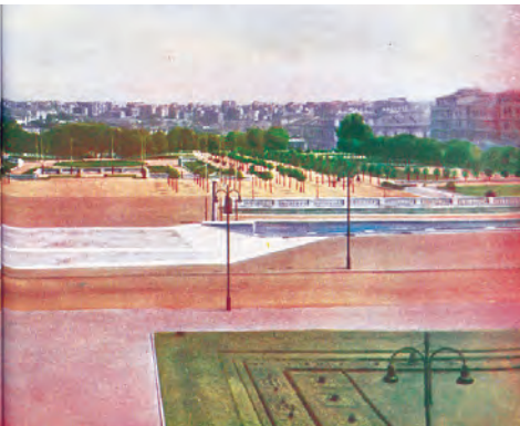
Şekil 7: İnönü Gezisi veya 1 no'lu park (Daver, Günay, Resmor, 1944)