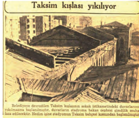
Şekil 9: Topçu Kışlası yıkılıyor (Cumhuriyet Gazetesi, 06.04.1940,5)

Dalan'ın İstanbul trafiğine çözüm getirmek amacı ile başlattığı yol açma çalışmaları sonucunda gerçekleşen yıkımlar ve tahribatlar Mimarlar Odası, eleştirmenler, şehirciler, kentliler tarafından eleştirilse de yangından mal kaçıırıcısına gerçekleşmiştir. Dalan büyük İstanbul projesini