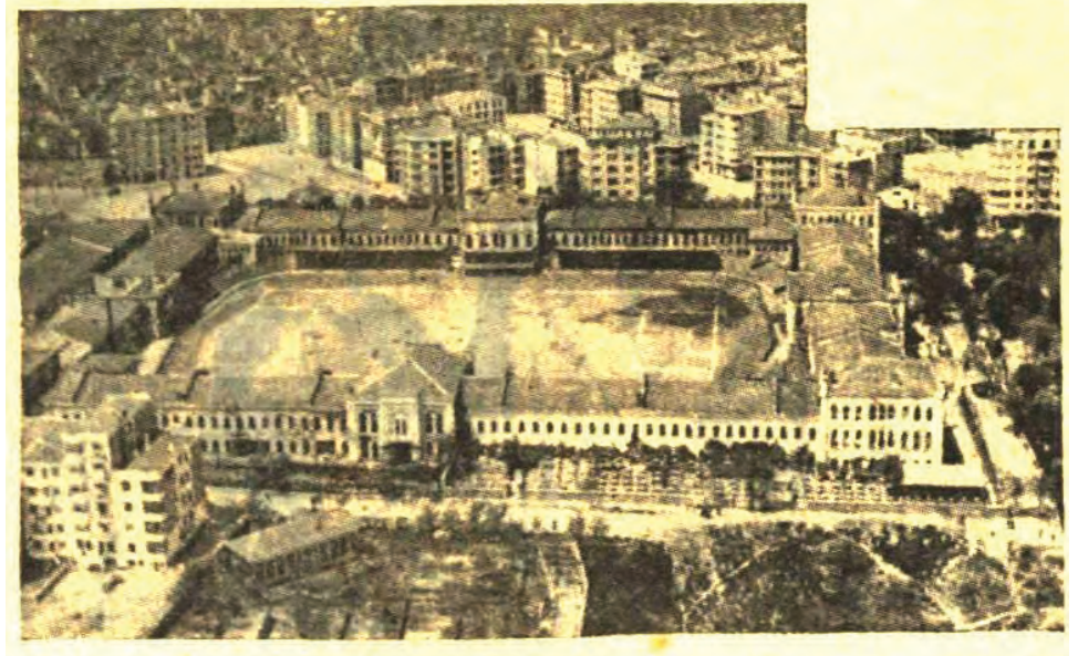
Şekil 4: Topçu Kışlası'nın hava fotoğrafı

elden çıkartılmış ve satış sözleşmesi 5 imzalanmış olmasının da kent peyzajının dönüşümünde büyük etkisi olmuştur. 20. yüzyılın başlarında Topçu Kışlası'nın işlevini yitirmesinin önemli bir nedeni Kışla'yı besleyen Talimhane Meydanı'nın imara açılması olmuştur (Şekil 4).