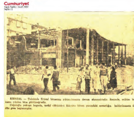
Şekil 11: Kristal Gazinosu Yıkılıyor, 1957, Cumhuriyet Gazetesi, 16.07.1957, 3