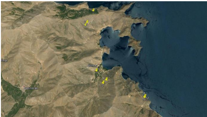
Şekil 3. Altınsaç ve İnköy mevki (Anonim, 2015a).