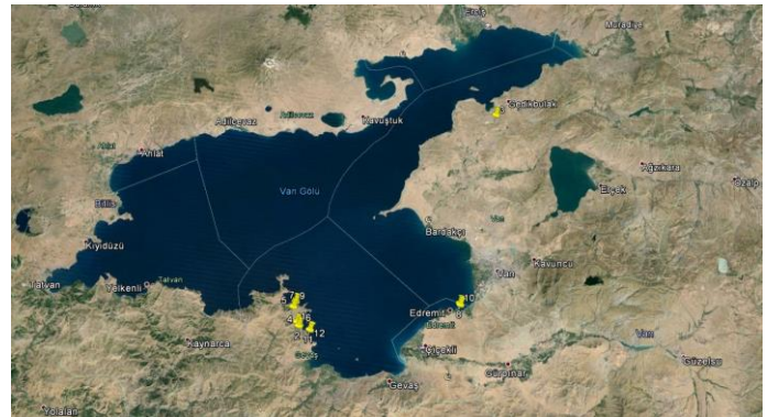
Şekil 4. Orkide toprak örneklerinin alındığı alanların genel olarak dağılımı (Anonim, 2015a).