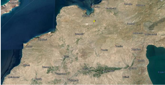
Şekil 1. Erciş yolu üzerinde Tasmalı Geçit mevki (Anonim, 2015a).

Araştırma; Van ilinde, deniz seviyesinden yüksekliği 1682-1945 m arasında değişen Tasmalı Geçit (Şekil 1), Edremit (Şekil 2), Altınsaç ve İnköy (Şekil 3), yörelerinde yürütülmüş olup, orkide yetişen farklı bölgelerden toplam 12 adet toprak örneği alınmıştır (Şekil 4). Toprak örneklerinin alındığı noktaların koordinatları Yer Konumlama Cihazı (Global Positioning System, GPS) ile belirlenmiştir (Çizelge 1).