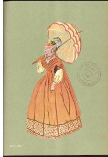
(b) Kısa kol dantel eldiven ve dantelli şemsiyeden oluşan bir sokak kıyafeti