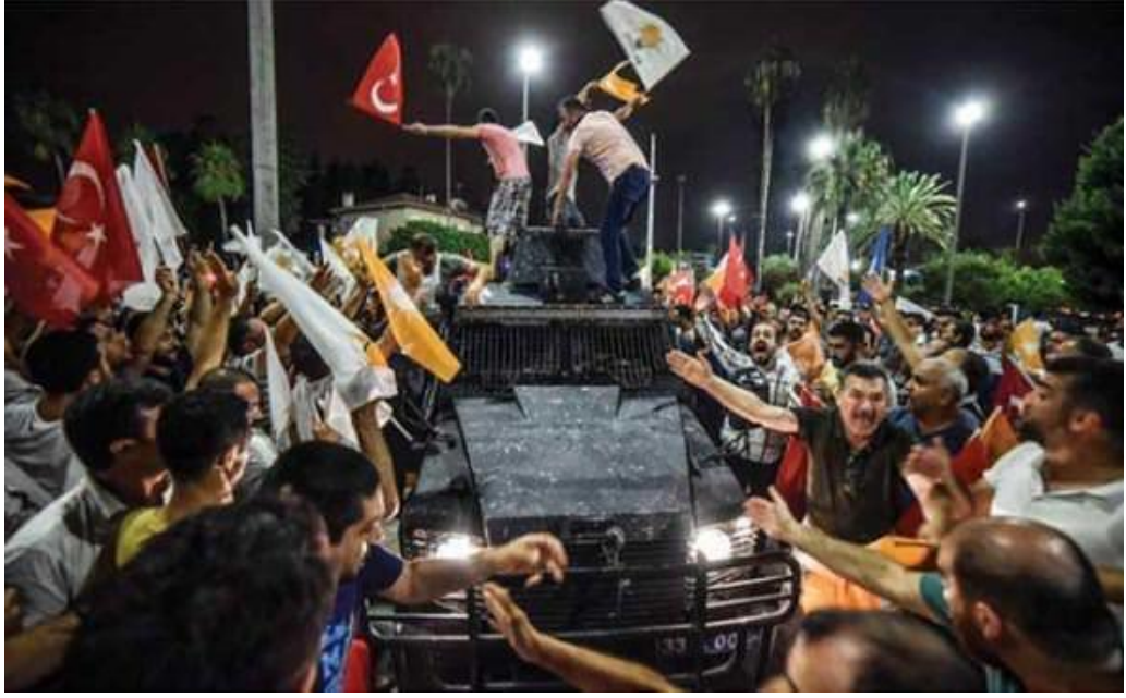
Fotoğraf 3: Bu fotoğrafta canları pahasına silahlı ve zırhlı araçların önüne duran ve üstüne çıkan insanlar görülmektedir.