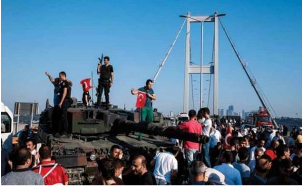
Fotoğraf 4: Fotoğrafta her türlü tehlikeye rağmen vatandaşların ölümü göze alarak tankların ve topların önünde ve üzerinde bu darbeye direndiği görülmektedir.

Darbeciler tarafından bu harekâtın komuta merkezi Ankara'nın Kazan ilçesindeki Akıncı Üssü seçilmiş, darbe oradan yönetilmiştir. Oradan kalkan uçaklar devlet kurumları ve vatandaşlar üzerine bomba yağdırmışlardır. 16 Temmuz da saat 04.30 da Başbakan Binali Yıldırım'ın havadaki uçaklara yere inme talimatı vermesi,