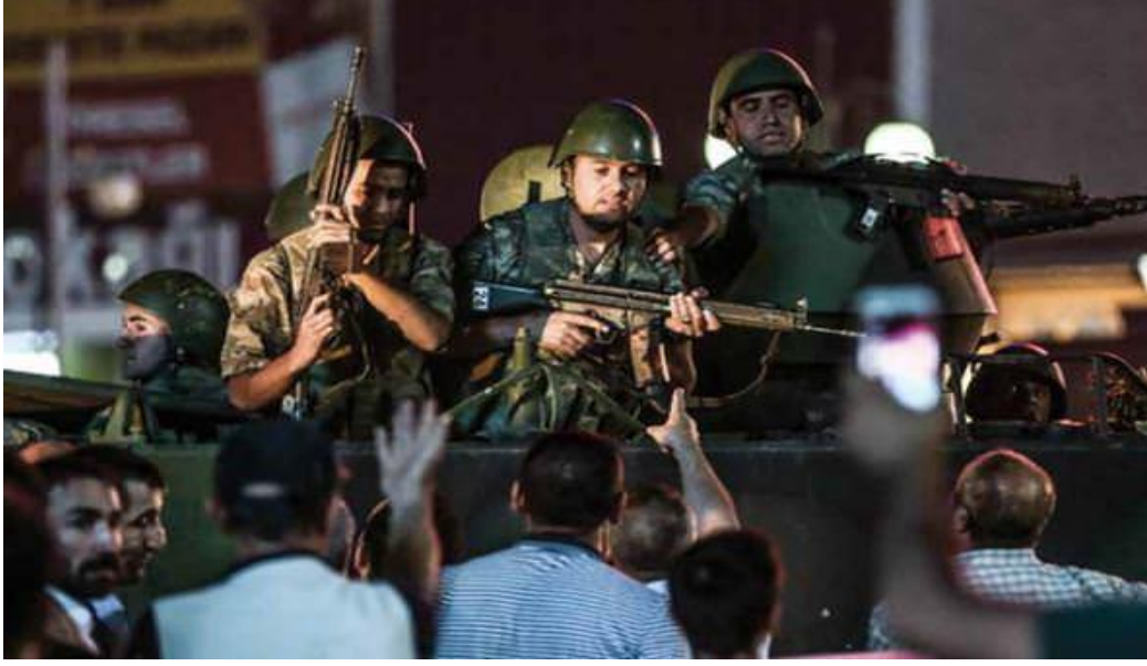
Fotoğraf 2: Vatandaş askere sen Türk bayrağı taşıyan bu insanlara silah kullanamazsın diye haykırıyor.

topların ve zırhlı araçların önüne durarak, tekerlerin altına yatarak ve halka mermi yağdıran zırhlı araçların üstüne çıkarak ölümü pahasına onlara engel olmuşlardır. O gece asker ve polislerden olduğu gibi sivil vatandaşlardan da çok sayıda ölen ve yaralanan olmuş, ancak topyekûn milletin gösterdiği bu kararlı tutum, darbenin başarısız olmasında en büyük etken olmuştur. Bayraklar ile meydanlara inen, kamu binalarına, köprülere, havaalanlarına yürüyen silahsız vatandaşlar eli silahlı askerlere sen bu bayrağı korumak, bu bayrağa uzanan elleri kırmak için varsın diye seslenmiş, Türk askerinin Türk bayrağı taşıyan kişilere kurşun atamayacağını haykırmıştır. Aşağıdaki resimler o gece yaşanan gelişmeleri açık ve net olarak göstermektedir.