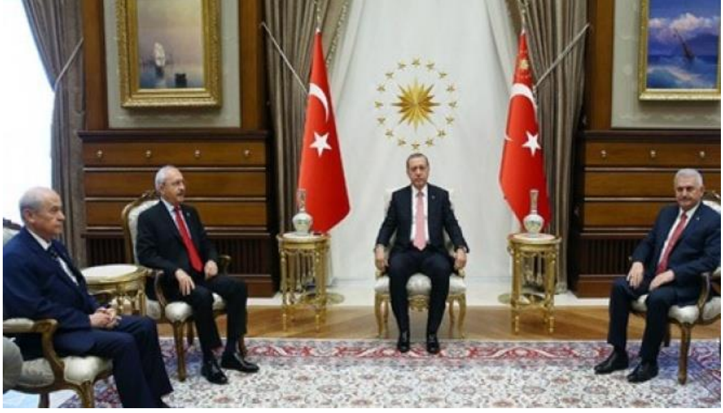
Fotoğraf 8: Cumhurbaşkanının Başbakan ve parti liderleri ile Cumhurbaşkanlığı Külliyesinde yaptığı toplantıdan bir kare.

Darbe teşebbüsünden sonra 27 gün boyunca meydanlarda yapılan toplantılara parti ayrımı yapmadan her partiden katılımlar devam etmişti. Kamuoyu ve siyasiler arasında da milli bir birlik oluşmuştu. 7 Ağustos 2016 tarihinde de İstanbul Yeni Kapı Meydanında milli birlik ve beraberlik mesajlarının verildiği Yeni Kapı Mitingi yapılmıştır (Yenişafak 2020, 7 Aralık). “Demokrasi ve Şehitler Mitingi” adı verilen Yeni Kapı Mitinginde sadece Türk Bayrağı taşınmış, bayraklarını alan binlerce, milyonlarca kişi meydana koşmuştur. Aşağıdaki resim bu durumu ortaya koymaktadır.