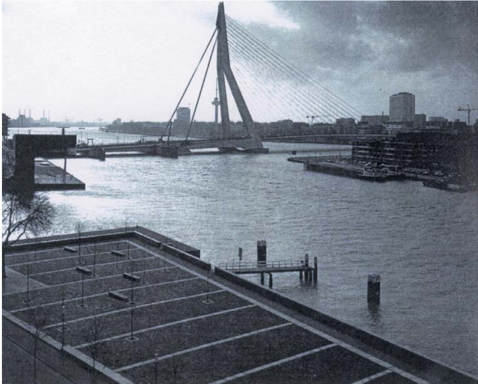
Şekil: 4 Kentsel kılınmış plastik öge-Estetik

2 Yıllardır ülkemizde yerel yönetimlerin ya da resmî kurumların doğrudan kendi bünyelerinde ya da sipariş vererek veya yarışma yoluyla ürettikleri tüm planlama-düzenleme-tasarım ilişkisi içindeki kentsel tasarım projeleri ve düzenlemeleri tasarımın müdahale aracı olarak kabul edilebilir.