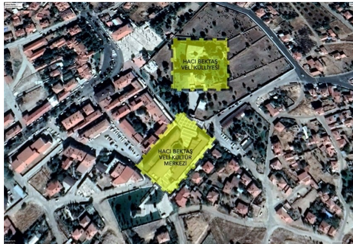
Şekil 1: Hacı Bektaş Veli Kültür Merkezi ve Çevresi