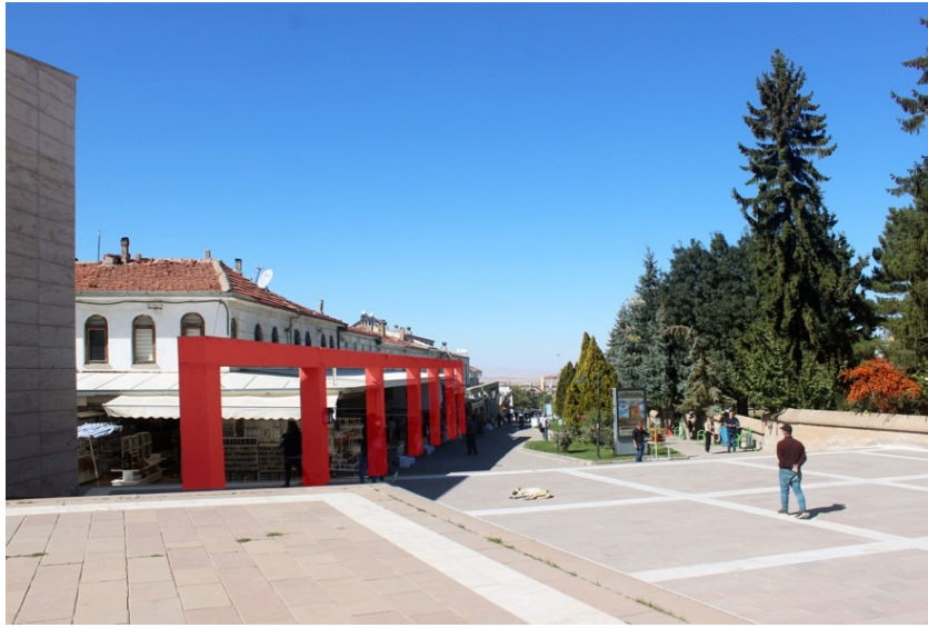
Şekil 8: Hacı Bektaş Veli Kültür Merkezi'nin Meydanından Ticari Alanlara Uzarak Kamusal Sürekliliği Sağlayan Strüktürel Elemanlar olarak Kolonatlar.

Bahsi geçen kamusalılık Türkçe kullanımı açısından kavram karmaşasına neden olabilecek “kamu yapıları” ifadesinden bağımsız bir niteliğe sahiptir. Türkçe olarak kamu kavramı çoğunlukla “devlet” ile ilişkilendirilen kamusallıkla bağdaştırılmaz. Yani buradaki “kamusal mekân” ifadesi devlet idaresi, kurumu, organı ya da kuruluşu bir mekân olarak algılanabilen ifadesinden ayrılmaktadır. Bunun yanında bir devlet organı aracılığıyla açılan yarışma sonucu hayat bulan her mimari yapının kamusal olarak addedilmeyeceği gibi bir mekânın kamusalılık sorgulamasının da salt özel mülkiyet üzerinden değerlendirilemeyeceği aşikardır. Neşe Gürallar (2009: 54) bu konuda “... söz gelimi tiyatro binaları kamu mülkü olmayabilir, özel şahıs ya da tiyatro gruplarına ait olabilir, ama kamu için var olurlar, yani kamusaldır.” ifadesini kullanılır. Kısaca ifade etmek gerekirse, kültür merkezi kamusal mekân olarak temsiliyetini ortaya koymaktadır. Çünkü toplum için var, toplum tarafından kullanılıyor, topluma açık; bütün bunların ötesinde toplumla iletişime geçmekte ve toplumun bireylerinin birbirleriyle bu mekânsal organizasyonda iletişimde oldukları gözlemlenebilmektedir.