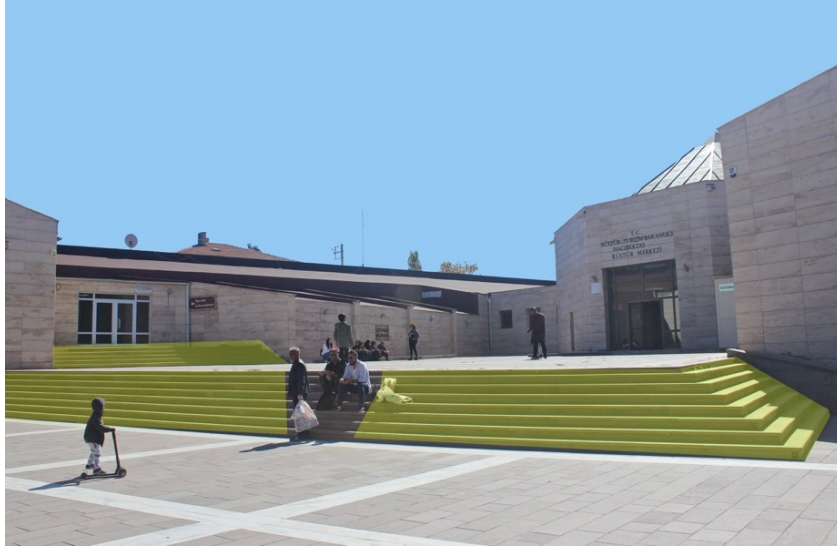
Şekil 5: Hacı Bektaş Veli Kültür Merkezi'nin Meydanı ve Kent Merdivenleri Kullanımı.

Özbay (2002) bu kullanıma şöyle açıklık getirmektedir: 1980'lerden itibaren Karaaslan mimarlığında Anadolu Mimarisini kendine referans edinmiştir. Ve tam da bu bağlamda yapılarında kültürel bir taban oluşturma arzusunda bulunmuştur. Bu durum bazı kesimlerce “kolaj” diye eleştirilmiş ancak öte yandan, Gürhan Tamer başta olmak üzere kimilerince oldukça önemsenerek dikkate alınmıştır. Tamer bu denemeleri “3. Ulusal Mimari” olarak adlandırmıştır. Yani Karaaslan'ın son yıllarındaki mimari anlayışı bu topraklara ait ama bir o kadar da çağdaş olan bir tavrı ortaya koymuştur. Zaten Karaaslan bu tür yapılara “batı dergilerinden fırlamış gibi duran tasarımlara ve bu tavrı destekleyenlere” karşı sert eleştirileri ile bilinmektedir.