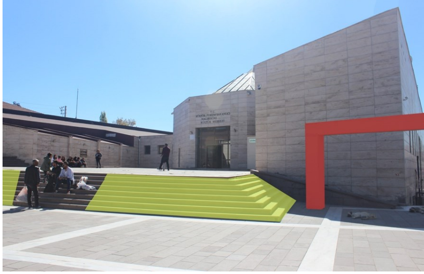
Őekil 6: Hac1 Bektař Veli K1lt1r Merkezi'nin Meydanı, Kent Merdivenleri ve Kolonatlar.