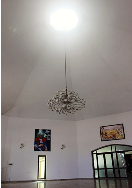
Şekil 4: Hacı Bektaş Veli Kültür Merkezi'nin Kümbet Formun Işıklık olarak Kullanımı.

Kültür merkezi yapısında Anadolu Selçuklu Dönemi'ni referans alarak tarihsel bir bağlamı yorumlayan kümbet formu (yeniden) ele alınmaktadır. Burada sekizgen bir formla üst açıklık oluşturularak doğal aydınlatma çözümü aranmıştır. Özbay (1993), Karaaslan'ın kümbet kullanımının bir imza haline geldiğinden bahsetmektedir. Bu kullanım onun yapılarında epeyce yaygındır. Buradaki kümbet kullanımı da aslında bağlamdan gelmektedir. Külliye'nin bir bileşeni olarak varlığını sürdüren kümbet Şekil 3'te, plan düzleminin sağ tarafında görülmektedir. Karaaslan'ın bağlamından ve işlevinden bağımsızlaştırarak doğal aydınlatma elemanı olarak kullandığı kümbet formu ise yarışma kapsamında tasarladığı kültür merkezi planının sol tarafında yer almaktadır. Bu form külliye'deki formun yansıtması olarak yine sekizgen bir ifadeyle temsil edilmektedir.