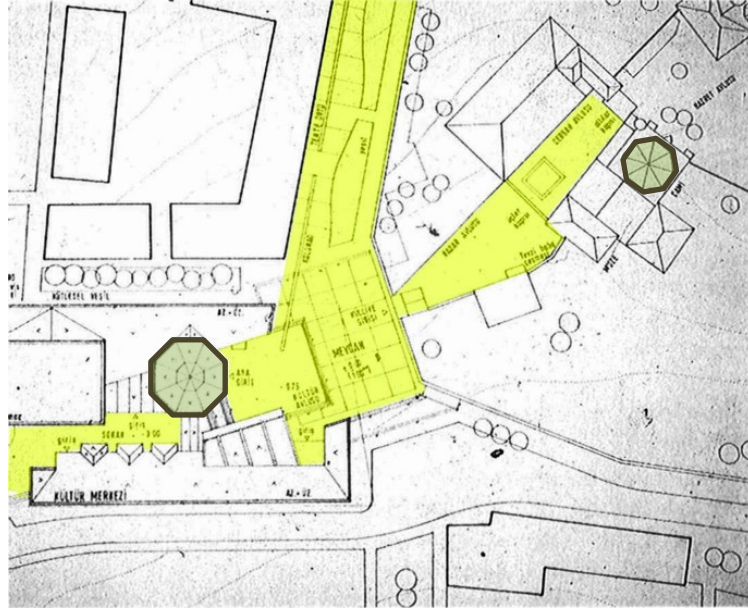
Şekil 3: Hacı Bektaş Veli Kültür Merkezi 1. Ödül Vaziyet Planı.

gerçekleşmesi sebebi ile, kamuoyunun oluştuğu alanlardır.” (Habermas, 2003: 60). Burada mekân ve bu mekânın kullanıcı tarafından ele alınış biçimi arasındaki ilişki öne çıkmaktadır. Kültür merkezi örneğinde mekân bütün kullanıcılara açıktır ve onlara bir temsiliyet alanı sağlama kapasitesine sahiptir. Kamusal mekân bu örnekten de anlaşılabilir gibi kamusal özelliklerinin yanı sıra bu tanıma uygun mekânsal özellikler de taşımaktadır. Bu kamusal mekân, fiziksel olarak mekânı aşan daha soyut ve geniş anlamı bir olguya işaret etmektedir. Kamusalılık çoğunlukla akla ilk olarak kapalı mekanları getirirse de salt kapalı bir alana referans vermemektedir. “Mekân” olarak örgütlenen ve bir tasarımcı tarafından planlanan “açık alanları” da “kamusal mekân” altında toplamak yerinde olacaktır.