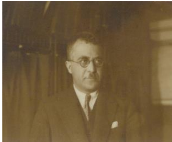
Hakkı Tarık Us