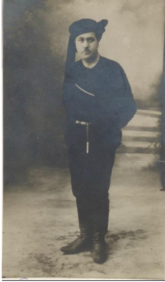
Milletvekili seçildiği Giresun'un yöresel kıyafetleriyle