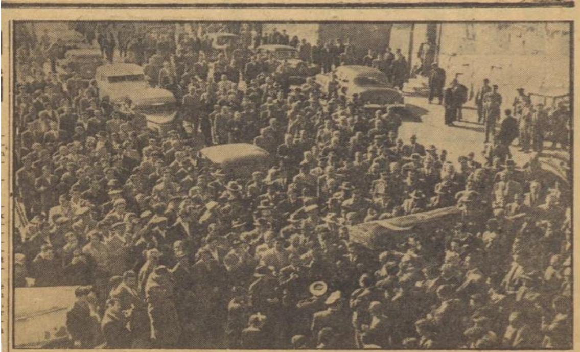
Rahmetli Hakkı Tarık Us'un tabutu eller üzerinde götürülüyor.