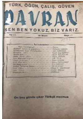
Resim 1: 1. Sayının Kapağı

Dergi, ilk sayısından itibaren Kayseri'nin yerel eşrafından aldığı reklamlarla, ekonomik destek bulmuş görünmektedir. Dergi adına dikkat çeken bir başka husus da "Ülküdaş Dergiler" ismiyle kendi fikriyatına yakın dergilere dair verdiği ilanlardır. Farklı sayılarda hakkında ilan verilen bu dergiler; 9 Eylül, Bayrak, Bizim Türkiye, Damla (Edirne), Çığır, Filiz, Kemalyolu, Kızılelma, Kürşad ve Yeni-Bozkurt'tur. Bahse konu dergiler genel hatlarıyla milliyetçi-Türkçü çizgide olmakla beraber bunların kimi Anadolucu, ırkçı, Kemalist veya Turancı bakış açısına sahip süreli yayınlardır.