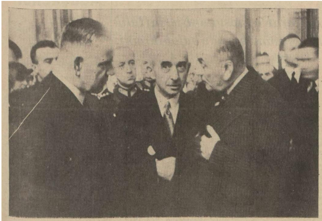
Tan , 5 Mart 1939, 1.