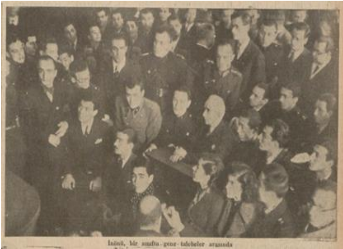
Cumhuriyet, 7 Mart 1939, 7.