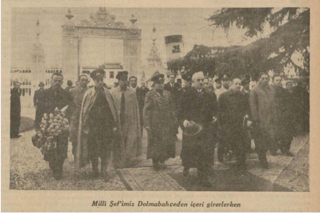
Ulus, 4 Mart 1939, 1.