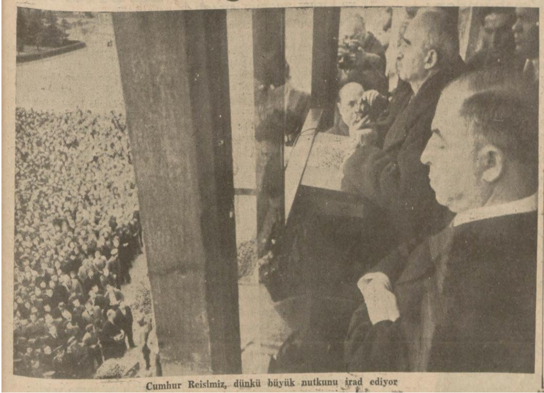
Cumhuriyet, 7 Mart 1939, 7.