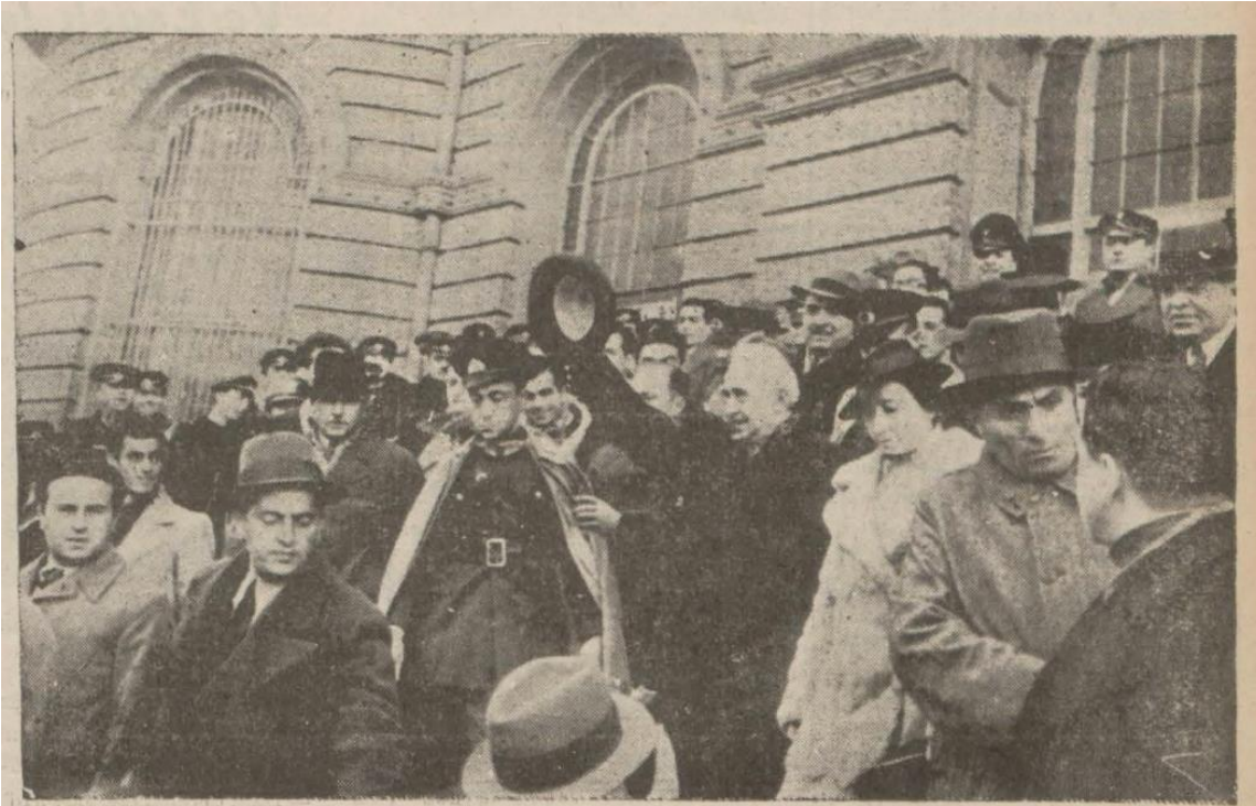
Milli Şef İsmet İnönü Haydarpaşa garından çıkarılırken kendisini istikbal eden halkı Selâmlıyorlar