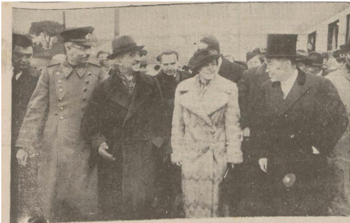
Milli Şef Refikaları ve Bolu mebusu Fethi Okyar istasyondan çıkarılırken