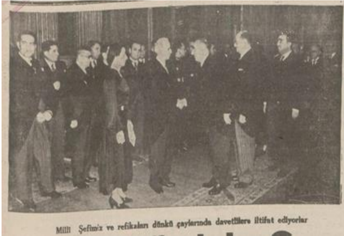
Yeni Sabah , 5 Mart 1939, 1.