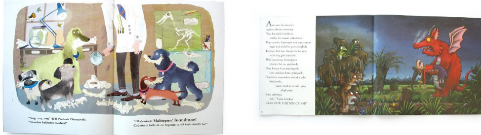
Görsel 5-6. Metin – resimleme ilişkisi. Soldan Sağa doğru, resimleyenler; Yuval Zommer, Axel Scheffler.

ise kırmızı canavarı korkutmak için bir hendekten bir başka canavarın çıktığı görülmektedir. Resimlemeye dikkatle bakıldığında bu canavarın aslında çamurla kamufle ve üst üste çıkmış köpek, kedi, kuş ve kurbağadan oluştuğu anlaşılmaktadır. Canavarı korkutma planını anlatan metne ait bu görünüm, yine metnin sınırları aşan, bunun da ötesinde başlı başına kendi yaratıcı görünümünü ortaya koyan bir uygulama örneğidir.