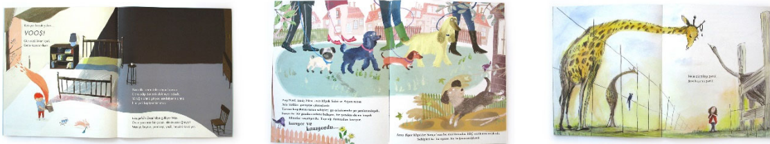
Görsel 18-19-20. Temel kompozisyon kurguları. Soldan sağa doğru resimleyenler; Ashling Lindsay, Yuval Zommer ve Jessica Meserve.

Yine bu değerlendirmeye göre Görsel 18-19-20.'de de karşılıklı sayfaların düzenlenmesi aşamasında sıklıkla başvurulan bazı temel kompozisyon kurallarına ait örnekleri görmekteyiz. Sol taraftaki örnekte boşluk ve istif düzenlemesine ait yaklaşım, sağ taraftaki örnekte kompozisyonu oluşturan öğelerin sayfa sınırları dışında da devam ettiği etkisini uyandıran yaklaşım ve alt taraftaki örnekte de büyük küçük kontrastlığını, gerilimini ifade eden bir yaklaşım izlenmektedir.