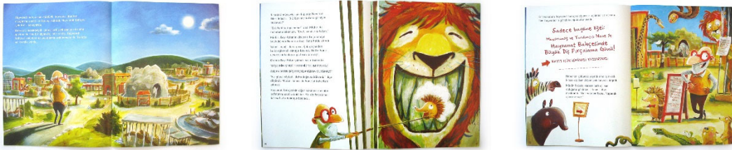
Görsel 15-16-17. Sayfalar arası kompozisyon ilişkileri. Resimleyen; Günther Jakobs.

Görsel 15-16-17.'da ise bu kez kompozisyon açısından olası monotonluk ya da sıradanlık tehlikesi karşısındaki çözüm alternatifi yer almaktadır. Örnekte; yine tek bir kitabın farklı sayfalarındaki farklı sahne kurguları dikkati çekmektedir. İlk karşılıklı sayfada geniş bir manzara karşımıza çıkarken, hemen yanındaki karşılıklı sayfa tasarımının sağ tarafında, tüm alanı kapsayacak büyüklükte bir figür görünümünün sahneyi oluşturduğu izlenmektedir. Son karşılıklı sayfa örneğinde ise figür detaylarının ideal biçimde algılanacağı, ne çok yakın ne de çok uzak olan bir düzen anlayışı bulunmaktadır. İşte bu noktada; arka arkaya gelen sayfaların bu şekildeki sayfa kurgusu ile oluşturulması sonucunda tekrar eden görüntü çağrışımının olası olacağı unutulmamalıdır. Elbette ki ideal boyutlardaki yaklaşım ile tüm sayfalar düzenlenebilir. Ancak bu durum, resimleyen açısından metne sadık kalma kaygısına daha fazla dikkat edildiğini gösterebilir. Oysa her bir boş sayfa, metinden bağımsız olarak önce çeşitli plastik öğeler (çizgi, leke, renk, doku gibi) sayesinde, estetik ve yaratıcı hazların kazanılacağı bir alana hizmet eder. Resimleyenin önünde bu tür öğeler ile kurgulanacak sayısız kompozisyon olasılığı bulunmaktadır.