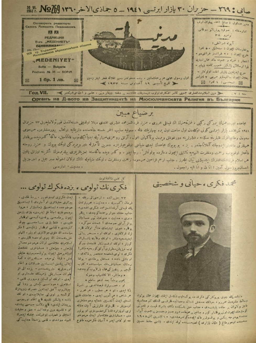
Belge 2: Mehmed Fikri'nin vefatından sonra Medeniyet'in ilk sayısı.